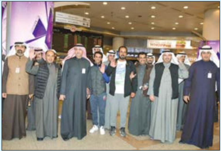
الثائب حمدان العازمي والسفير ساسي الحمد والقنصل فلاح الجحرف مع المواطنين الأربعة العائدين من إيران (قاسم باشا)

وشددت المصادر على أن النواب عازمون على ضرورة حل القضية بالطريقة التي تنعكس إيجابياً على الرياضة والرياضيين الكويتيين والمجتمع بشكل كامل وإنهاء هذا الملف للفرغ للملفات أخرى لا تقل أهمية عنه.