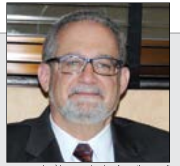
السيرافير الاميركي لورانيس سيلفرمان

المركزي: 2018 بداية تطبيق حوكمة الرقابة الشرعية بالبنوك الإسلامية 33