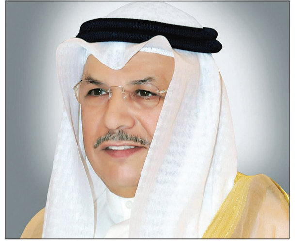
الفريق م. الشيخ خالد الجراح

وجهد الإدارة العامة للعلاقات العامة والإعلام الأمني الدعوة إلى عدد من الإعلاميين الأمنيين للقاء نائب رئيس مجلس الوزراء ووزير الداخلية الفريق م. الشيخ خالد الجراح، ومن المقرر ان يلتقي الجراح أيضا كبار قيادات الوزارة في لقاء تعريفى وذلك في مخيم «الداخلية» بمنطقة صباحان.