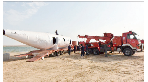
استعدادات التمرين «شامل 3»

صرح نائب مدير عام الإدارة العامة للإطفاء لشؤون المكافحة اللواء جمال البلهيص بأن الإدارة ستقيم تمرين «شامل 3» وهو من أكبر التمارين التي تقام في الكويت وبناء على توجيهات وزير الدولة لشؤون مجلس الوزراء الشيخ محمد العبدالله ومدير عام الإدارة العامة للإطفاء الفريق خالد المكراء، حيث تقرر بدء التمرين بعد غد بمشاركة 13 جهة حكومية.