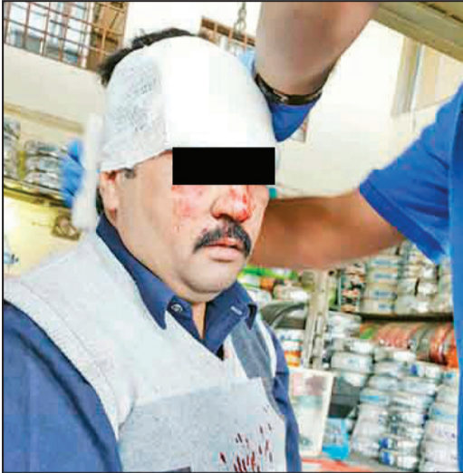
الاسعافات تقدم للمصاب عقب الواقعة

«طالبته دينارين فأصر على دفع دينار، وحينما أبلغته ان هذا لا يجوز قام بضربي وشق رأسي» بهذه العبارة يبلغ وافد باكستاني بتفاصيل ما حدث معه في منطقة الصليبية الصناعية.