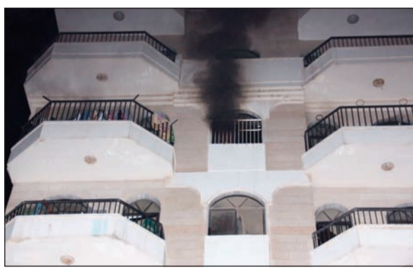
الدخان يتصاعد من الشقة