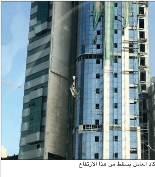
كاد العامل يسقط من هذا الارتفاع

تمكن رجال إطفاء المدينة من إنقاذ عامل قبل أن يهوي من ارتفاع شاهق عقب انقطاع سلك مربوط بوسيلة تستخدم في نقل مواد البناء.