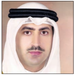
الشيخ نمر الصباح

يضم مساحات متنوعة تبدأ من 90 متراً إلى 200 متر، كما سيضم المشروع مولا تجارياً بمساحة 3000 متر مربع على دورين وملحق بالمشروع جراج خاص بكامل المسطح ومنطقة ترفيهية للأطفال ومطاعم وكافيهات، حيث يشرف على تنفيذ المشروع أكبر المكاتب الاستشارية الهندسية.