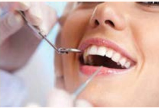
يتم زراعة الغرسة المعدنية داخل عظم الفك