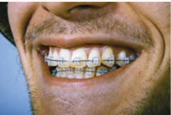
نلجأ الى التقيويم في حال اختلاف ترتيب الاسنان

العظم، ولكن الاختلاف عند الشركات المصنعة لهذه الزراعات من حيث الجودة والكفاءة، ففي المرحلة الأولى تتم زراعة الغرسة المعدنية داخل عظم الفك، ولتعزيز ثبات الزرعة تمكثت من ثلاثة الى ستة شهور، بعد هذه المدة تنتقل الى مرحلة التركيب حيث يقوم الطبيب بأخذ المقاسات اللازمة لإرسالها الى المختبر وذلك لعمل التاج السني الذي يثبت على الزرعة.