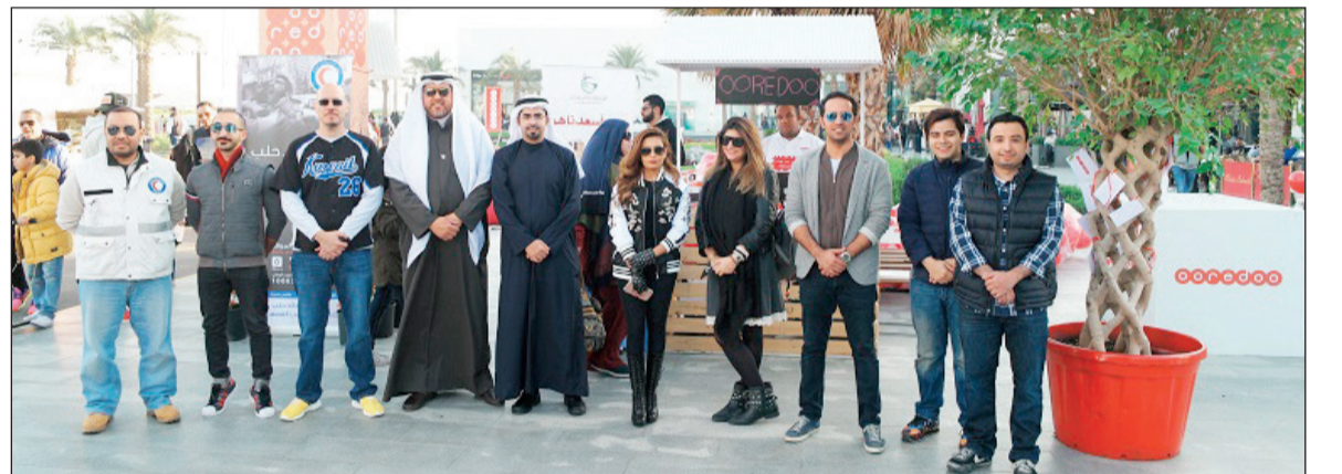
لقطة تذكارية خلال الحملة

الأيوب: علامتنا التجارية تركز على مبادئ أساسية