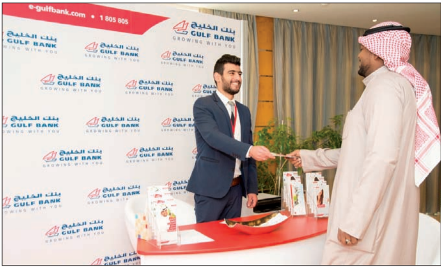
جناح بنك الخليج في المعرض

قام بنك الخليج بتقديم رعايته الذهبية للمعرض السنوي الأول للغذاء والصحة وذوي الاحتياجات الخاصة تحت عنوان «حياتك في صحتك وصحتك في غذائك»، الذي نظم برعاية من وزارة الصحة ومشاركة من الشركات المختصة من الكويت والدول الأوروبية وذلك في فندق المارينا بتاريخ 18 و19 ديسمبر 2016. ويعد هذا المعرض السنوي للصحة والغذاء لذوي الاحتياجات الخاصة الأول في الكويت والذي يهدف إلى القضاء الضوئ على أهمية الغذاء الصحي لذوي الاحتياجات الخاصة، ونشر التوعية حول آلية الغذاء لذوي الاحتياجات الخاصة، والتعريف بدور الغذاء الصحي في مكافحة السمنة لاسيما بين الأجيال الناشئة.