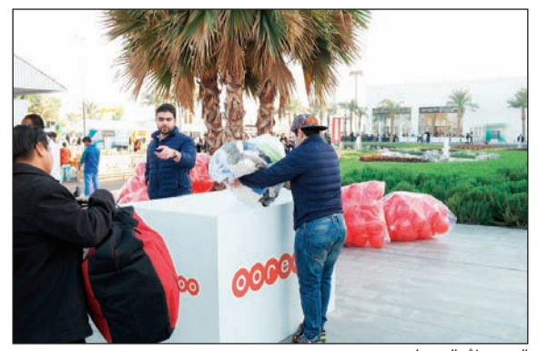
البرج لاهالي حلب