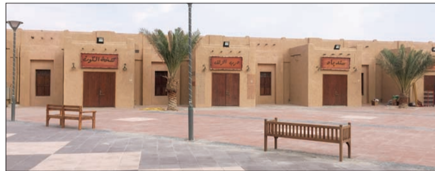
قرية صباح الأحمد التراثية

السالي، إلى جانب ذلك سيتم توفير بعض الآليات الإطفاء القديمة التي كانت تستخدم أيام الستينيات والسبعينيات لكي يطلع عليها الجمهور الزائر للقرية، منوها بالجهود التي يبذلها قسمها الوقاية والعلاقات العامة في الإدارة العامة للإطفاء اللذان سيكونا لهما دور في التوعية وتوزيع الكتب والبروشورات على الزوار.