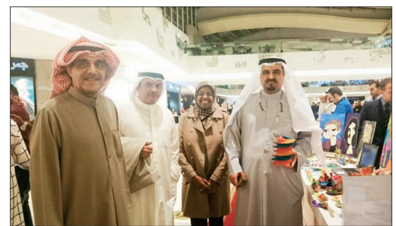
الهيئة التدريسية مادة التربية الفنية لقسم الاحتياجات الخاصة مع الطلاب المشاركين