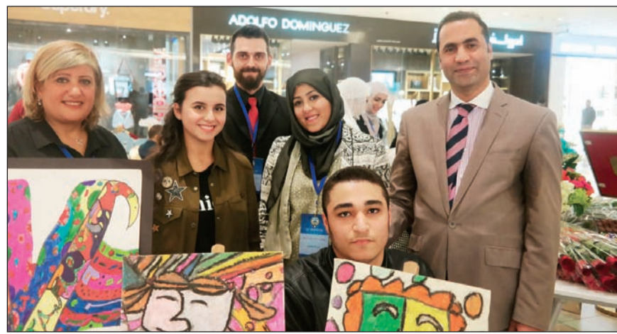
مجلس إدارة مدرسة دسمان ثنائية اللغة والهيئة العامة لشؤون ذوي الإعاقة

من قبل أولياء الأمور. وأكملت ديزمن «إن كادرنا الأكاديمي في قسم الاحتياجات الخاصة ذو خبرة وكفاءة عالية في المتطور الذي يعنى الطالب ثقة عالية بالنفس ويبرز مهاراته سواء كانت فنية أو مهنية والتي قد تكون غير مكتشفة