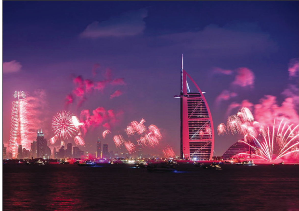
صورة ارشيفية للالعاب النارية والاحتفالات في رأس السنة في دبي