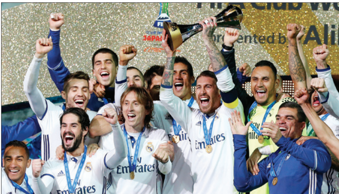
فرحة نجوم ريال مدريد أبطال كأس العالم للأندية

سجل النجم البرتغالي كريستيانو رونالدو ثلاثية ليقود فريقه إلى إحرار لقب بطل العالم للأندية بفوزه على كاشيما أنتلرز الياباني 2-4 (الوقت الأصلي 2-2) بعد التمديد في المباراة التي أقيمت أمس على ملعب يوكوهاما الدولي. وجاءت أهداف رونالدو في الدقائق 60 و 97 و 104 بعد أن افتتح الفرنسي كريم بنزيمة التسجيل في الدقيقة التاسعة، في حين سجل هدفي كاشيما غاكو شيباساكي في الدقيقة 44 و 52. وهي المرة الثانية التي يتوج فيها ريال مدريد بطلاً في هذه المسابقة بعد عام 2014، ليضيفها إلى دوري أبطال أوروبا والكأس السوبر الأوروبية بقيادة مدربه الفرنسي زين الدين زيدان الذي تسلم المهمة قبل أكثر من عام بقليل خلفاً لرافاييل بينيتز.