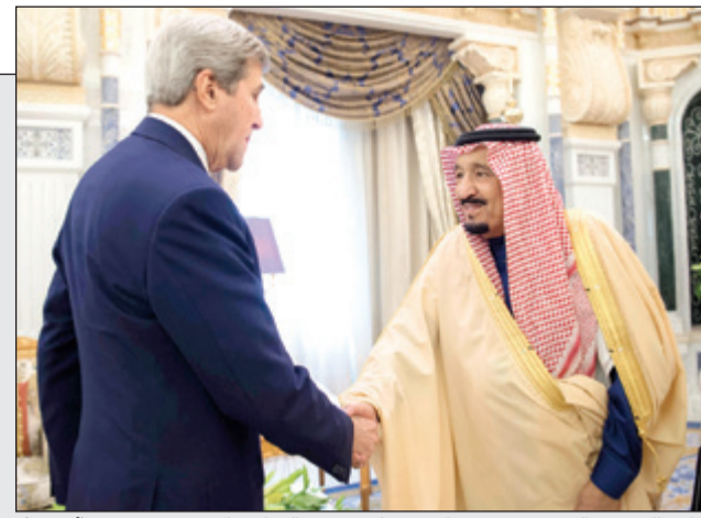
خادم الحرمين الشريفين مستقبلاً جون كيري في الرياض أمس

خادم الحرمين الشريفين وكيري بحنا الوضع اليمني والعلاقات الثنائية 36