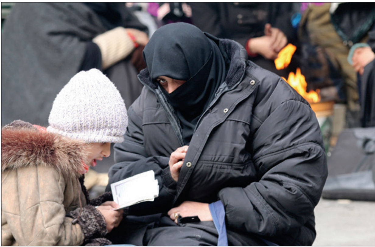
سيدة تقرأ مع طفلها القرآن بانتظار إجلائهما من شرق حلب

عواصم - وكالات: دخل الاتفاق «الروسي-التركي-الإيراني» لتهجير من تبقى من سكان شرق حلب، حيز التنفيذ. وبدأت «الباصات» في نقل دفعة جديدة من المدنيين ومقاتلي المعارضة وأسره أسس، مقابل أخرى دخلت إلى بلدتي كفريا والفوعة لنقل عدد من سكانها، بحسب وسائل إعلام النظام السوري. وكاد الاتفاق الجديد أن يلقي مصير سابقه، بفعل التطورات حيث أفاد ناشطون عن إدخال إيران لشروط جديدة تقضي بتهجير نحو 1500 من سكان بلدة مضيا المحاصرة من قبل النظام أيضاً، لكن ذلك أثار عدداً من فصائل المعارضة ودفعهم إلى إحراق عدد من الباصات التي كانت تنتظر على مدخل «كفريا» و«الفوعة» المواليين للنظام.