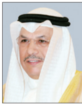
الفريق م. الشيخ خالد الجراح

الحربي عن توجهه لتقنين ابتعاث المرضى للعلاج بالخارج من خلال استقطاب المختصين من الأطباء الزوار بمختلف التخصصات لإجراء العمليات التي يحتاج إجراؤها السفر. وأضاف الحربي في تصريح خاص لـ «الأنباء» على هامش اجتماعه مع مديري المناطق الصحية والمستشفيات