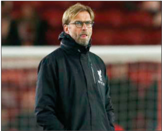
أنا قادم يا إيفرتون

لي حقا. هذه أول زيارة إلى غوديسون بارك وتطلع لها كثيرا في مرحلة مهمة جدا بالموسم» وأكد استمرار مشاركة الحارس سيمون مينويليه بعد الانتقادات التي تعرض لها لوريس كاريموس، بينما سيظل المهاجم دانييل ستوريج ولاعب الوسط إيمري تشان خارج التشكيلة.