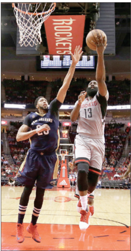
هاردين يتلاعب بخصوصه (أ.ب)

98، على وشك معادلة الرقم القياسي السابق لعدد الرميات الثلاثية الناجحة في مباراة واحدة (23)، والذي كان يتشاركه مع غولدن ستايت ووريترز. إلا ان روكيتس اكتفى خلال مباراة الأربعاء باثني وعشرين رمية ناجحة، قبل ان يتم من كسر الرقم الجمعه. وكسر هيوستن أيضا الرقم القياسي لعدد المحاولات الثلاثية (50 محاولة)، والذي كان يحمله بنفسه منذ 25 نوفمبر. وأنهى هاردين المباراة مع 29 نقطة و11 متابعيه و13 تمريرة حاسمة، ليسجل الثلاثية المزدوجة الـ 15 في مسيرته، والثانية تواليًا وكان هاردين عادل في مباراة الأربعاء، رقم نجم كرة السلة السابق حكيم اولاجوان مع 14 «تريبيل دبل»، وتلقى من هيوستن أريك غوردن مع 29 نقطة، علما أنه لم يبدأ كأساسي، وازداد تريفور اريزنا 20 نقطة بينها خمس ثلاثيات. اما نيو أورليانز الذي خسر ستة من مبارياته السبع الاخيرة أمام هيوستن، فقادته انطوني ديفس مع 19 نقطة على رغم مشاركته في 22 دقيقة من المباراة، قبل خروجه مصابا في الربع الثالث. أما تيرنس جونز فسجل 16 نقطة وثمانية متابعات.