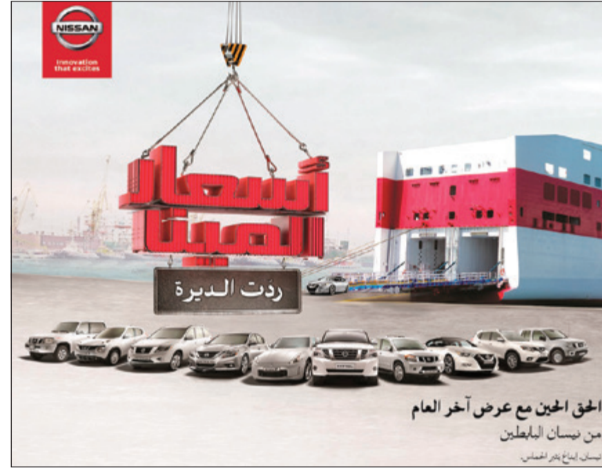
الحق الحين مع عرض آخر العام من نيسان الباطين

وفي فئة السيدان، يشمل العرض، سيارة «نيسان ماكسيما» الفاخرة ومستويات الأداء العالية، والتي تأتي مع مجموعة من المحركات القوية، فضلاً عن مجموعة أخرى من الخيارات الجذابة. وحقت «نيسان الباطين» جميع العملاء على الاستفادة من هذا العرض الرائع ومكافأة أنفسهم بهدية لا تنسى من قبلها.