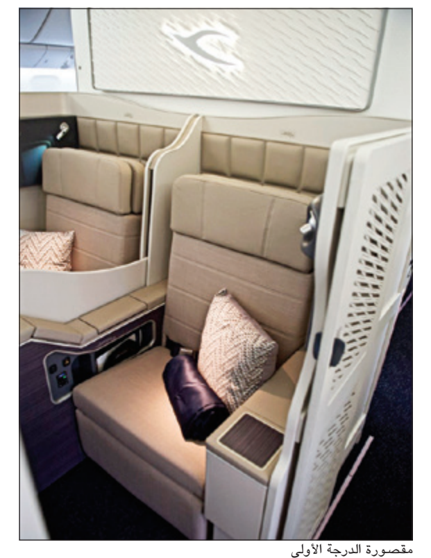
مقصورة الدرجة الأولى

بدأت طائرة طراز بوينغ 300ER-777، والتي انضمت مؤخراً لأسطول الخطوط الجوية الكويتية، أعمالها التجارية لرحلتها الأولى الطويلة المدى مباشرة إلى لندن بعد أن قامت الطائرة برحلتين تجاريتين إلى دبي يوم الخميس 15 ديسمبر 2016. وتخدم الخطوط الجوية الكويتية وجهة لندن مباشرة من الكويت بواقع 10 رحلات أسبوعياً وفقاً لمواعيد «جدول الشتاء» لهذا العام الذي تم الإعلان عنه في نهاية أكتوبر الماضي، وتعتبر هذه الوجهة واحدة من أكثر وجهات الكويتية رواجاً على شبكتها العالمية.