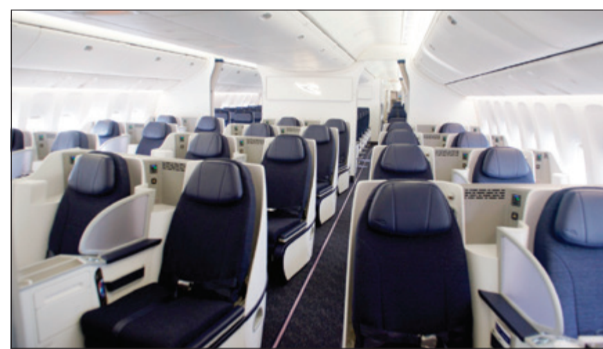
مقصورة درجة رجال الأعمال الخاصة بالطائرة