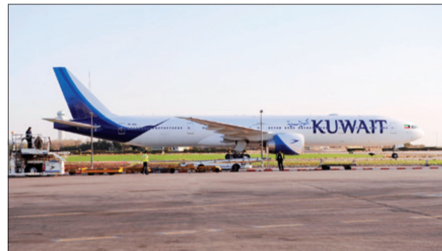
«فيكا»، على أرض مطار الكويت الدولي