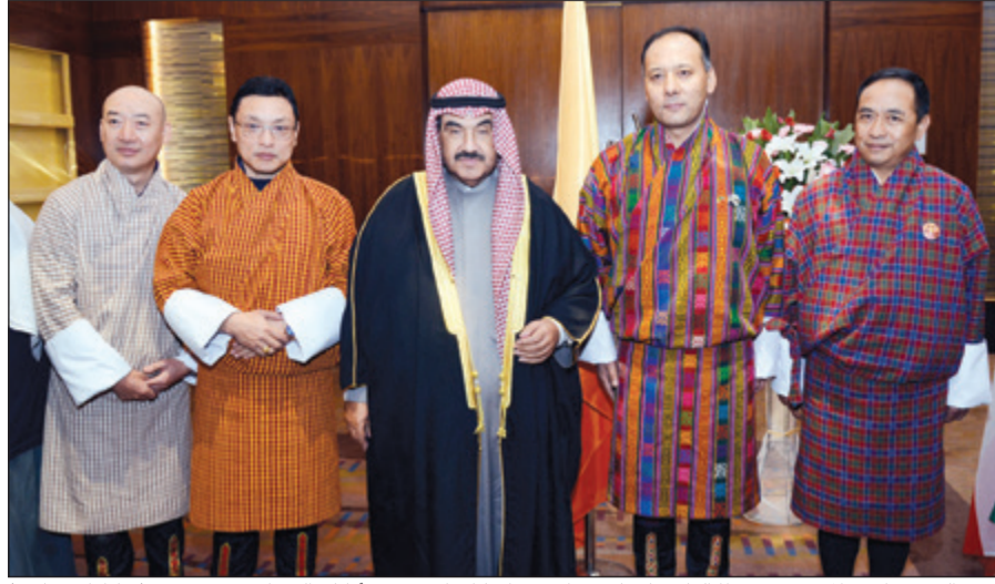
سمو الشيخ ناصر المحمد متوسطا القائم بأعمال سفارة بوتان كارما بنتسو وأركان السفارة (شانا فاس قاسم)