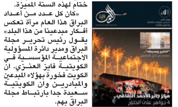
ملحق المجلس الوطني للثقافة والفنون والآداب ديسمبر-يناير 2017