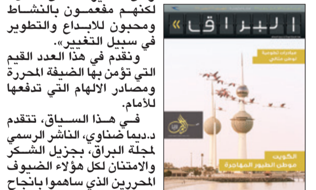
غلاف البراق عدد ديسمبر-يناير 2017

تميز بها هؤلاء المبدعين وساهموا بإثراء جميع أعداد سنة 2016.