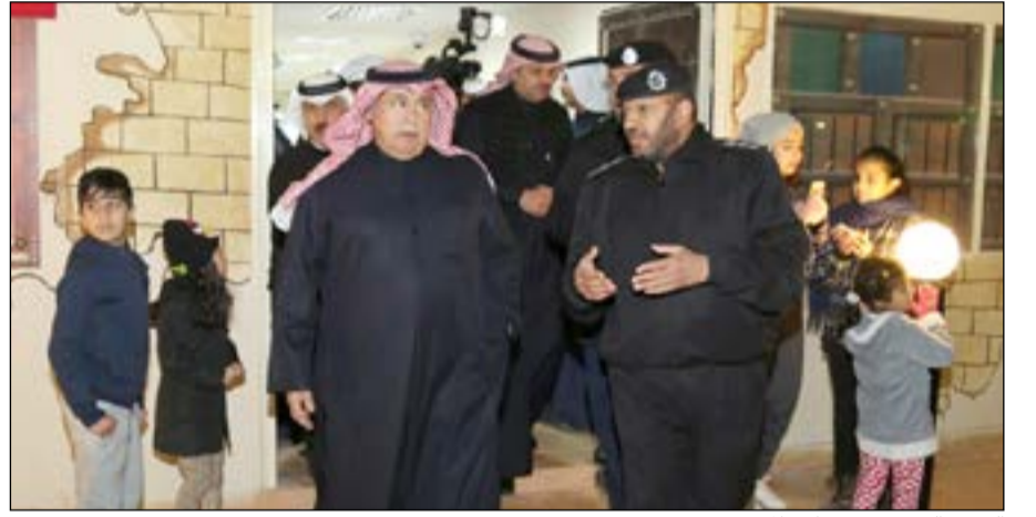
الفريق الفهد يتفقد مرفاق المخيم

دورة تدريبية لترقية 219 نقيباً محمد الجلامه أصدر وكيل وزارة الداخلية الفريق سليمان الفهد أمس الأول قراراً تضمن إلقاء 219 ضابطاً برتبة نقيب بدورة ترقية تمهيدا لحصولهم على رتبة رائد، على أن تبدأ الدورة من 25 ديسمبر الجاري حتى 19 يناير المقبل. وتوقع مصدر أن تتم ترقية عدد من ضباط الداخلية «ترقيات اعتبارية» بدءاً من شهر مارس 2017. الاسماء على موقع الانباء الالكتروني www.alanba.com.kw