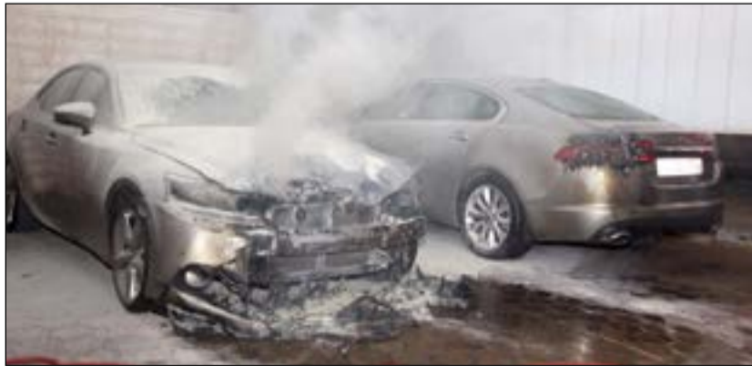
المركبتان اللتان شب فيهما الحريق بالقيروان

عاني الظفيري أخذ رجال إطفاء مركز الصليبخات حريقاً شب في مركبة فارغة وامتد إلى أخرى كانت تقف بجوارها، وكان مواطن يعمل موظفاً بوزارة الكهرباء من مواليد 1982 قد تقدم إلى مخفر شرطة القيروان وأبلغ عن احتراق مركبته اليابانية موديل 2014 رمادي اللون أمام منزله، وقد رقم لوحاتها، وكذلك مركبة زوجة شقيقه، الإنجليزية