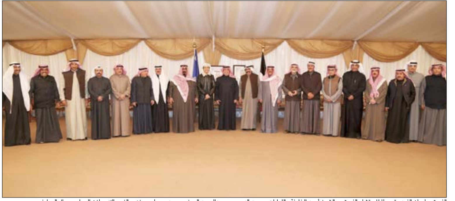
الفريق سليمان الفهد متوسطا المستشار الفريق م. الشيخ احمد الخليفة واللواء محمود الدوسري وعبد الحميد العوضي وعبد بوسليب وزهير النصرالله ومامن الجراح وجمال الصايغ