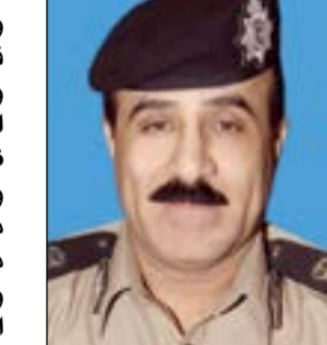
اللواء ماجد الملجد

مطلوباً للسجن 5 سنوات، وبحسب مصدر أمني، فإن إدارة التنفيذ الجنائي وصلت اليها معلومات بأن السورية التي ضبطت قبل 6 أشهر بنهمة الإجهاض وصادر بحقها حكم بالحبس متوارية عن الأنظار في منزل شقيقها في سلوى، وعليه تم توجيه فرقة من التنفيذ الجنائي ليتم ضبط السورية واقتيادها الى إنهاء إجراءات ضبطها قبل إحالتها لقضاء 8 سنوات في السجن نظير تهم الإجهاض.