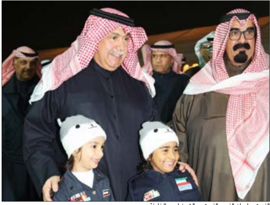
الفريق سليمان الفهد والفريق م. الشيخ احمد الخليفة