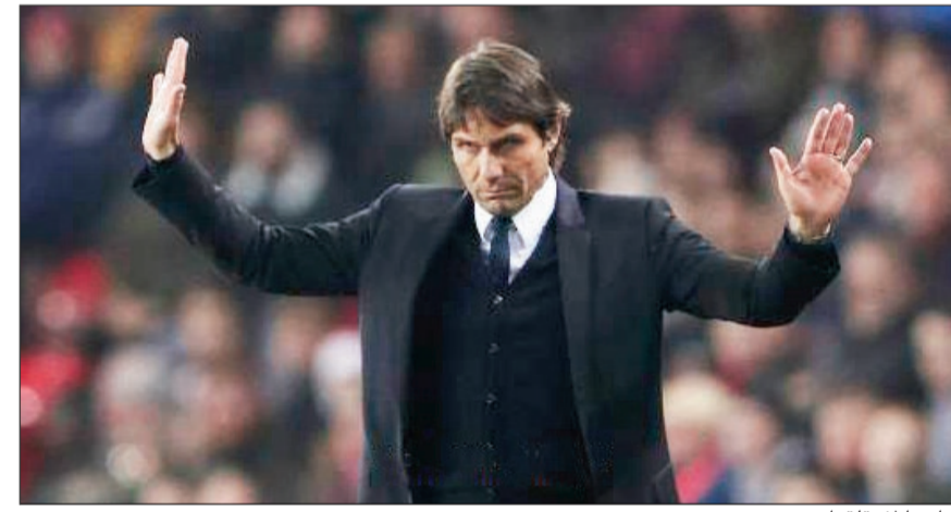
«انا هنا لا نلقوا»

مدرب البلوز أنطونيو كونتي حسم مصير أوسكار دوس سانتوس بعد الأنباء التي أكدت اقترابه بقوة من الانتقال إلى الدوري الصيني. وقال كونتي: «موقف أوسكار سيوضح خلال الأيام القليلة المقبلة».