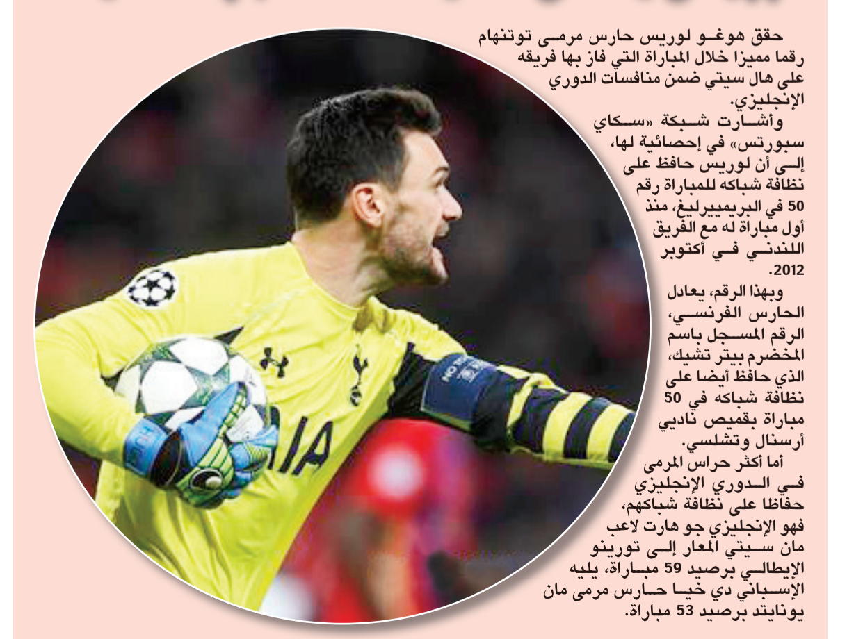
لوريس يعادل تشيك: 50 مباراة نظيفة

حقق هوغو لوريس حارس مرمى توتنهام رقما مميزا خلال المباراة التي فاز بها فريقه على هال سيتي ضمن منافسات الدوري الإنجليزي. وأشارت شبكة «سكاي سبورتنس» في إحصائية لها، إلى أن لوريس حافظ على نظافة شبابه للمباراة رقم 50 في البريميرليغ، منذ أول مباراة له مع الفريق اللندني في أكتوبر 2012. وبهذا الرقم، يعادل الحارس الفرنسي، الرقم المسجل باسم المخضرم بيتر تشيك، الذي حافظ أيضا على نظافة شبابه في 50 مباراة قميص نادي آرسنال وتشلسي. أما أكثر حراس المرمى في الدوري الإنجليزي حفاظا على نظافة شباهم، فهو الإنجليزي جو هارت لاعب مان سيتي المعار إلى تورينو الإيطالي برصيد 59 مباراة، يليه الإسباني دي خيسا حارس مرمى مان يونايتد برصيد 53 مباراة.