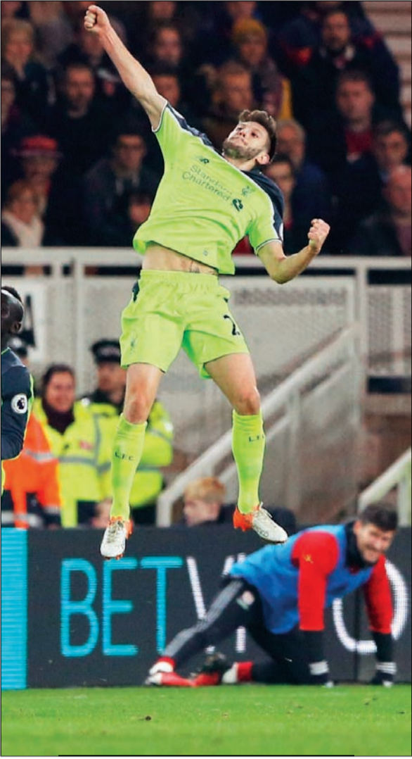
للاتنا يحتفل بهدفه