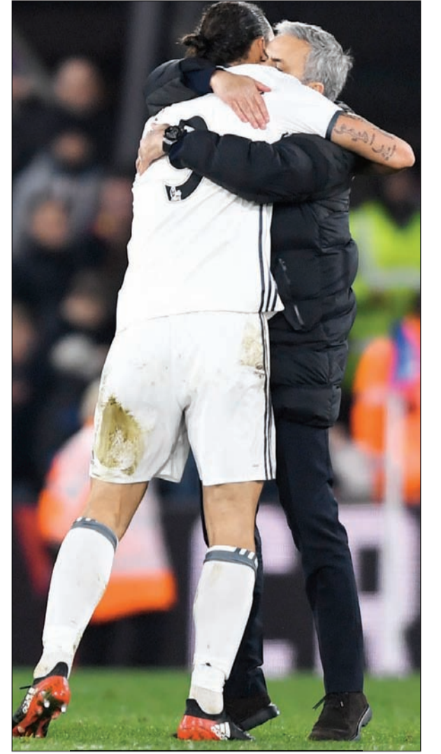
زلاتان ينقذ السيشل ون

روتليدج (78)، وتغلب وست هام يونايتد على ضيفه بيرتلي بهدف لمارك نوبل (45) رافعا رصيده الى 16 نقطة في المركز السادس عشر، بفارق نقطة خلف منافسه الثالث عشر. وتعادل ستوك سيتي مع ضيفه ساوثمبتون سلبا. ترتيب فرق الصدارة: 1 - تشلسي 40 نقطة من 16 مباراة 2 - ليفربول 34 من 16 3 - آرسنال 34 من 16 4 - مان سيتي 33 من 16 5 - توتنهام 30 من 16