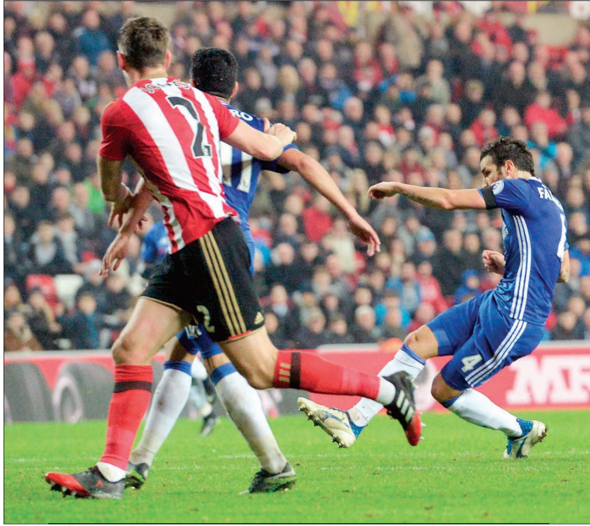
فابريغاس يؤكد ابتعاد تشلسي بالصدارة