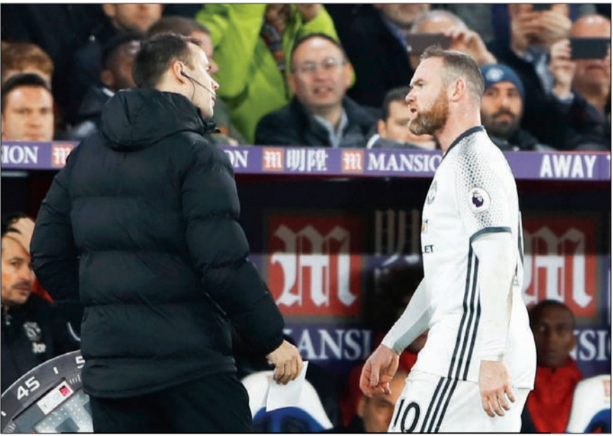
تصرف غريب من روني

سوء حظ روني أن مورينيو كان يجلس أمامه، وشاهد ما فعله، مؤكدة ان ذلك قد يؤثر على تواجد روني في تشكيل الشياطين الحمر خلال المواجهات المقبلة.