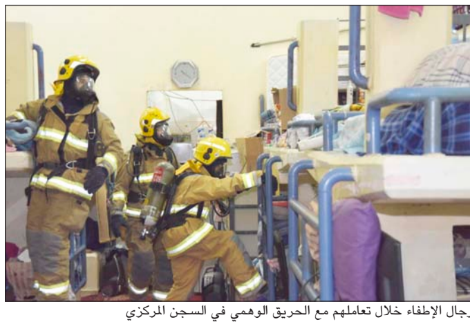
رجال الإطفاء خلال تعاملهم مع الحريق الوهمي في السجن المركزي

نفذت الإدارة العامة للإطفاء صباح امس تمرينا عمليا في مبنى إدارة السجن العمومي (السجن المركزي) بمشاركة مراكز إطفاء الشيوخ الصناعية وجليب الشيوخ ومركز الإنقاذ الفني، وقد تركز سياريو التمرين العملي على وجود حريق في الدور الأرضي في أحد غرف العنبر رقم 2 في مبنى إدارة السجن العمومي (مجمع السجون المركزي) وبسببه انتشر الدخان في مرمرات عنابر السجن وحجز الدخان مجموعة من المساجين وهم داخل الزنازين الخاصة بهم، وقامت فرقة طوارئ من إدارة السجن بإخلاء المساجين الى الفسحة الخارجية التابعة لمبنى السجن مع تعداد المساجين للتأكد من الجميع، وتبين وجود عدد 4 مساجين مفقودين احدثهم من ذوي الاحتياجات الخاصة ولم يتم إخلاءهم من المبنى.