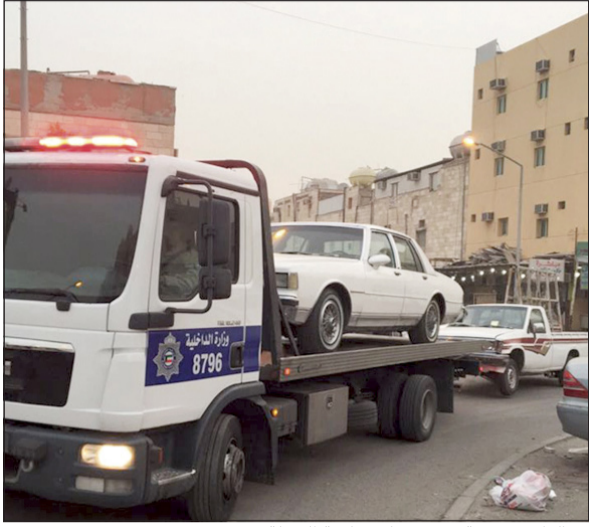
مخالفات مرورية حشرت على خلفية الحملة