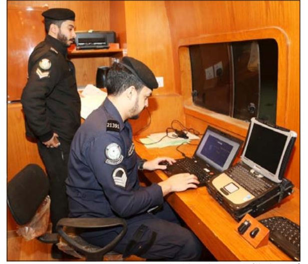
أحد رجال الأمن يديق على بيانات الموقعين

المواطنين والمقيمين على ضرورة التعاون مع رجال الأمن بعدم إيذاء أو التستر على أي مخالف للقوانين أو مطلوب للعدالة تجنباً للوقوع تحت طائلة القانون، ومخالفي القوانين وذلك على مطالبه الجميع بحمل إثبات الشخصية سواء كان مواطناً أو مقيماً مع إبلاغ مكفولهم بضرورة ذلك حتى لا يتم توقيفهم ومسألته.