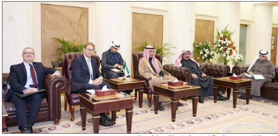
الرئيس الغانم مع وزير الدولة لشؤون الشرق الأوسط البريطاني

تطرق الى بعض الأمور الإدارية والمالية والتنظيمية المتعلقة بالأمانة العامة واتخذ القرارات المناسبة بشأنها. من جانب آخر، استقبل رئيس مجلس الأمة مرزوق الغانم بمكتبه امس وزير الدولة لشؤون الشرق الأوسط وأفريقيا في المملكة المتحدة توباس الوود وذلك بمناسبة زيارته الرسمية للبلاد. وجرى خلال اللقاء استعراض علاقات التعاون الثنائي بين البلدين الصديقين وسبل تعزيزها وتطويرها في شتى المجالات. كما تطرق اللقاء الى عدد من القضايا والموضوعات ذات الاهتمام المشترك وآخر مستجدات الأوضاع على الساحتين الإقليمية والدولية وخاصة تطورات الأوضاع في حلب. وحضر اللقاء مساعد وزير الخارجية لشؤون أوروبا السفير وليد الخبيزي والمستشار في إدارة شؤون أوروبا محمد يعقوب حياتي.