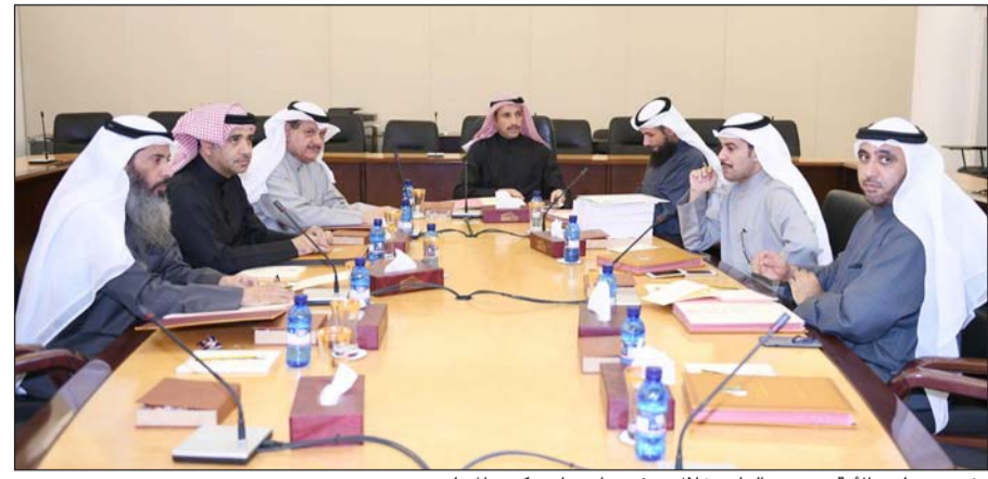
رئيس مجلس الأمة مرزوق الغانم خلال ترؤسه اجتماع مكتب المجلس

أعلن رئيس مجلس الأمة مرزوق الغانم توقيع الكويت اتفاقية تبادل المتهمين مع بريطانيا، مؤكداً أن من شأن هذه الاتفاقية بعد المصادقة عليها من برلمانى البلدين أن تمنح سراق المال العام من التجول في شوارع لندن، فيما كشف عن تفويضه من قبل مكتب المجلس لترتيب اجتماع مع الحكومة في القريب العاجل. وقال الغانم في تصريح إلى الصحافيين أن مكتب المجلس عقد أول اجتماعاته امس، منوهاً بالروح الإيجابية التي أبدتها الأعضاء وإصرار الأعضاء أن يكون الفصل التشريعي للإنجازات.