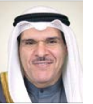
الشيخ سلمان الحمود

أكد وزير الإعلام وزير الدولة لشؤون الشباب الشيخ سلمان الحمود أن النطق السامي الذي تفضل به صاحب السمو الأمير الشيخ صباح الاحمد، في افتتاح الفصل التشريعي الـ 15 لمجلس الأمة الاحد الماضي يعد بمنزلة خريطة طريق للعمل الوطني على مختلف الأصعدة. جاء ذلك في تصريح للشيخ سلمان لوكالة الأنباء الكويتية (كونا) أمس عقب اجتماعه مع المدير العام لهيئة العامة للرياضة الشيخ أحمد المنصور ووكيل وزارة الدولة لشؤون الشباب الشيخة الزين الصباح والمدير العام لهيئة العامة للشباب عبدالرحمن المطيري وقيادات رياضية وشبابية. وقال الشيخ سلمان ان النطق السامي يشكل خريطة طريق وعمل شاملة للشباب الكويتي خلال المرحلة المقبلة بما تضمن من تشخيص دقيق للاوضاع المحلية ووصف الحلول الناجحة لها بشكل يمكن الكويت من تنوؤ مكانتها الإقليمية والدولية التي تستحقها. وأضاف ان الحكمة والحذقة السياسية والقيادة التي يتسم بها سموه جعلته يضع الشباب في سلم أولويات واجتهادات سموه مقدما لهم كل انواع الدعم والرعاية والاهتمام. وأضاف ان النطق السامي أكد على توجيه السلطتين التنفيذية والتشريعية إلى ضرورة تطوير وزيادة الاهتمام برعاية الشباب والاستماع اليهم ومشاركتهم وتربيتهم على الاعتدال وتعزيز روح التعاون والعمل الجماعي وتحقيقهم على قبول الاختلاف والرأي الآخر وفتح ابواب المستقبل امامهم بإيجاد فرص العمل الحقيقية لبناء مستقبل الوطن مدفوعين ومتسلحين بقدرة الولاة والانتفاء الوطني. وأشار إلى ضرورة العمل وفق التوجهات السامية الواردة في النطق السامي لاسيما انها تأتي والكويت تستعد لتتوجهها عاصمة للشباب العربي للعام 2017 مشيدا بالاهتمام والدعم والرعاية التي يوليها سمو ولي العهد لقطاعات الشبابية