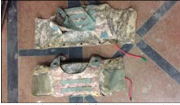
حزام ناسف اعدهت المجموعة الإرهابية لأحد الأعمال الإجرامية الجديدة