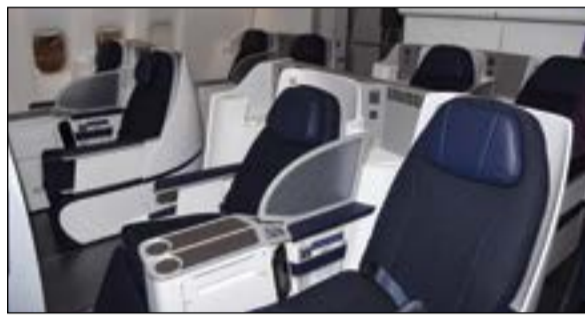
مقبورة درجة رجال الأعمال