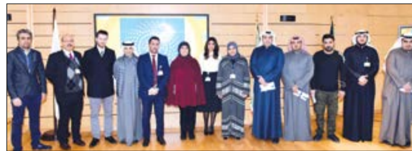
لقطة جماعية لفريق مشروع سدرة

فإن شركة نفط الكويت تبعث برسالة إلى العالم أجمع بأنها ملتزمة بشدة بحماية البيئة والحد من انبعاثات الكربون من أجل خير الإنسانية، مشيراً إلى أن هذا هو أول مشروع لشركة نفط الكويت مسجل مع وكالة التنمية النظيفة) في إطار