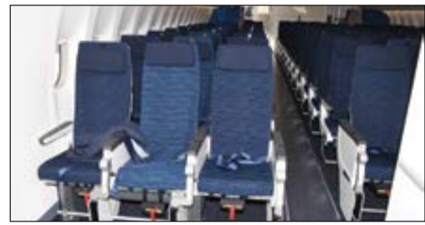
مقاعد الدرجة السياحية في حلتها الجديدة