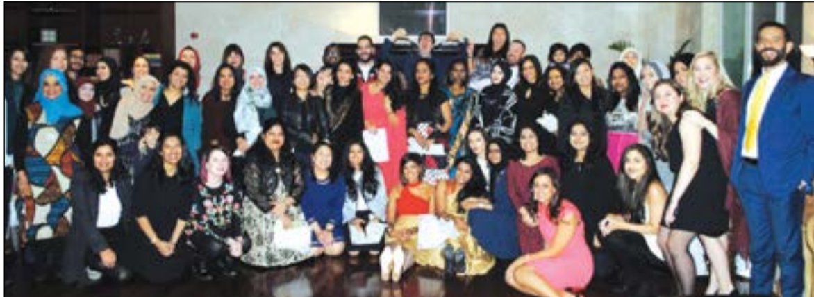
صورة جماعية للمشاركين في حفل العشاء

وفقاً لرسالتنا ورؤيتنا تجاه الكويت، حيث حققنا إنجازاً عظيماً هذا العام بدمج 10 أطفال إلى مدارس التعليم العام، وخلال العامين الماضيين تم دمج 14 طالباً إلى مدارس التعليم الخاص بدون مساعدتين. وأضاف: نتطلع قدماً إلى دمج المزيد من الأطفال داخل المجتمع خلال عام 2017، ونبقى آمليين للعمل بشك وثيق مع الحكومة الكويتية لزيادة عدد الأطفال الذين نساعدهم، واتوجه بالشكر لفريق العمل لجهودهم المتواصل يوماً بعد يوم تجاه الأطفال وعائلاتهم، كما أشكر الأسر على الثقة