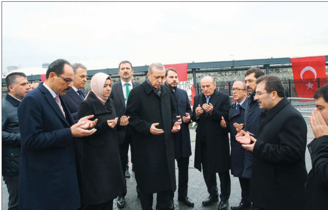
الرئيس التركي رجب طيب أردوغان وكبار المسؤولين يقرآن الفاتحة على أرواح ضحايا تفجير إسطنبول خلال زيارته للموقع أمس

وقالت الجمعية في بيان إنها «تدين الاعتداء الإرهابي» التي تعرضت لها إسطنبول. ورأت أن هذا الاعتداء «أنتى بسبب مواقف تركيا الداعمة للظلمين، والمناهضة للظلم والطغيان، وبسبب سعيها الحثيث لإعمال مبادئ العدالة الإنسانية بدلا من الشرائع الدولية السائدة المتحيزة في تغليب مصالح القوى على حساب حقوق الضعيف».