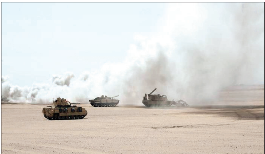
جانب من فعاليات التمرين الإماراتي - الأمريكي المشترك «المخلب الحديدي 2»

القوات المسلحة الإماراتية ونظيرتها الأميركية وذلك انطلاقاً من حرص القيادة العامة للقوات المسلحة الدائم على رفع مستوى الأداء والكفاءة والعمل بروح الفريق الواحد وفق استراتيجية واضحة المعالم تهدف إلى الارتقاء بالمستوى العام والجاهزية القتالية لقواتنا المسلحة للتعامل مع الأجهزة والأسلحة الحديثة على كل مسارح العمليات.