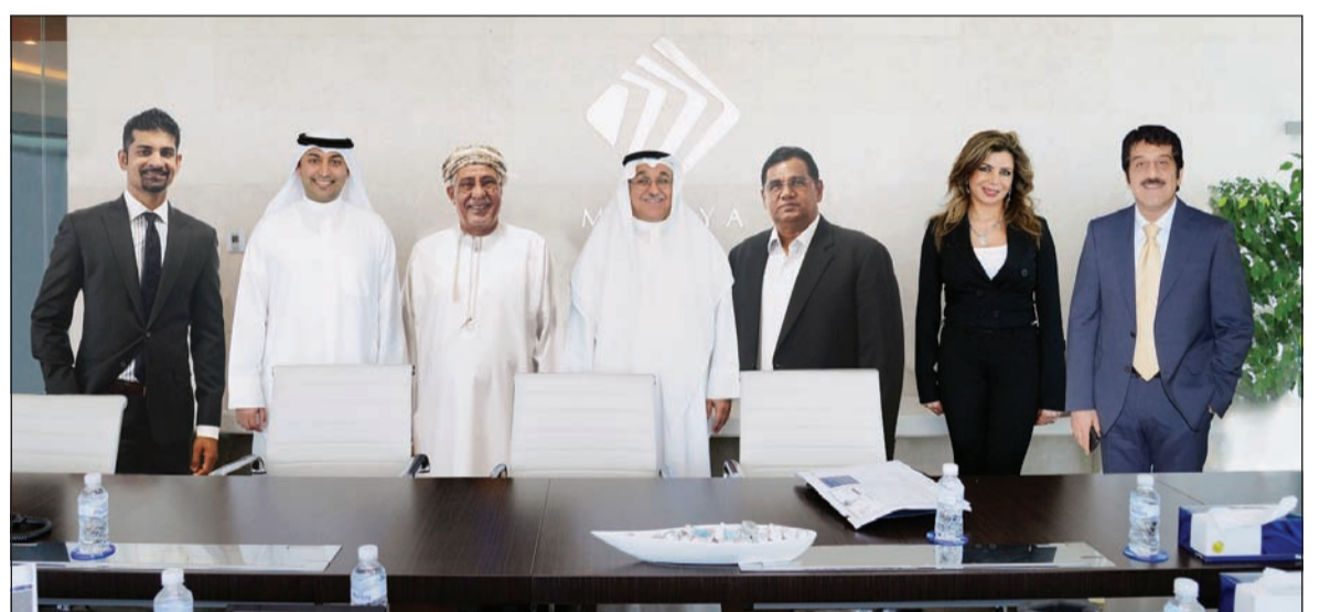
أعضاء مجلس الإدارة في شركتي «المزايا» و«الهاجري» خلال توقيع الاتفاقية