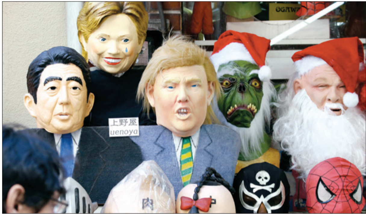
متجر ياباني يعرض اقنعة ترامب وشيلزوني و هيلاري كلينتون للبيع في طوكيو امس

من جانبه، طالب الرئيس الأميركي «بارك أوباما»، أجهزة بلاده الاستخباراتية بإجراء «مراجعة شاملة لفرصة روسيا» الإلكترونية على الانتخابات التي شهدتها الولايات المتحدة في 8 نوفمبر المنصرم. وقالت مستشارة أوباما للأمن القومي ليزا مونتاكو في حفل فطور نظمته مجموعة «ذا كريستيان ساينس مونيتور» أن من الضروري «فهم معنى تلك الاختراقات» وتفصيلها واستخلاص العبر وتعميمها، مشيرة إلى أن أوباما ينتظر تقريراً بهذا الشأن قبل مغادرة منصبه في 20 يناير وتولي دونالد ترامب الرئاسة.