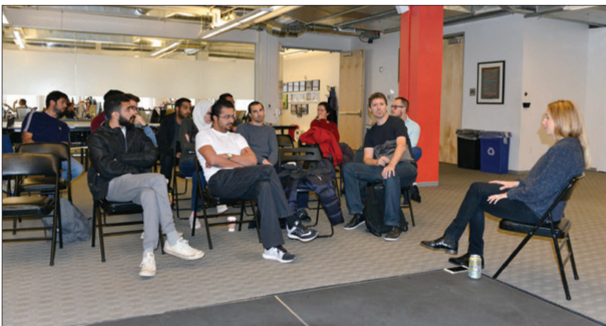
جانب من فعاليات البرنامج