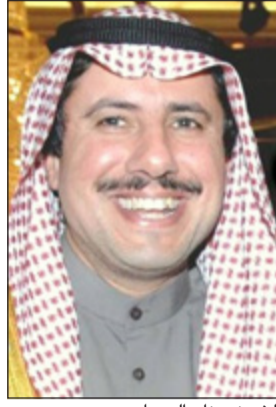
الشيخ عزام الصباح