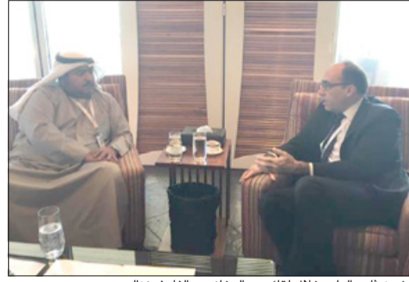
الشيخ ناصر العلي خلال لقائه مع اليخاندرو الفارغونزاليس

المنامة - «كونا»: بحث رئيس جهاز الأمن الوطني الشيخ ناصر العلي مع الأمين العام المساعد للشؤون السياسية والأمنية في حلف شمال الأطلسي (ناتو) اليخاندرو الفارغونزاليس تحضيرات افتتاح المركز الإقليمي للحلف في الكويت الشهر المقبل.