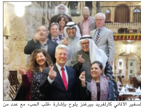
السفير الألماني كارل فريد بيرغنز يلوح بإشارة «قلب الحب» مع عدد من ممثلي الصحف المحلية

الصراع الوحيد الذي لا يمكن أن يكون سياسياً هو الحرب على الإرهاب وداعش بشكل خاص، معرباً عن سعادته من تقدم قوات التحالف على «داعش» والحق الخسائر والهزائم بها. وعن سعي الكويت للحصول على مقعد غير دائم في مجلس الأمن وهل ستدعم ألمانيا الطلب الكويتي، أوضح السفير: انه لا شك أننا سندعم طموح الكويت في الحصول على مقعد غير دائم في مجلس الأمن لاسيما انها الدولة الوحيدة التي رشحت نفسها في المنطقة. وفيما يخص الزيارة المرتقبة لوزير الخارجية الألماني لكويت قال بيرغنز: لا شك أننا نترقب هذه الزيارة، متمنياً ان يتم الإعلان عنها في اقرب وقت ممكن لكن إلى الآن لم يتم تحديدها. وعن حجم الاستثمارات الكويتية في ألمانيا وعن إمكانية تنميتها في السنوات القادمة بين انه من الصعب