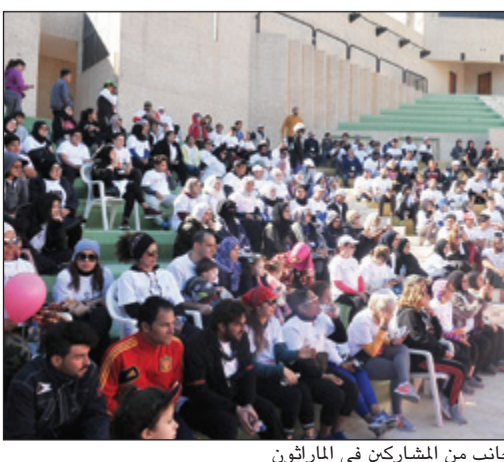
جانب من المشاركين في الماراثون

وكشف نائب رئيس مجلس إدارة حملة (كان) د.خالد الصالح أن هذا الماراثون تطلقه (كان) للعام الرابع على التوالي، وتسمى من خلاله لتوعية الجمهور عن أمراض السرطان، بهدف تغيير نظرة المجتمع لهذه الأمراض باعتبارها أمراض مزمنة يمكن الشفاء منها إذا ما اتخذت التدابير اللازمة نحو الوقاية منها أولا ثم اكتشافها في مراحلها المبكرة وذلك لضمان علاجها والشفاء منها في كثير من الأحيان. وأضاف «هناك ما يقرب من 2000 مريض يصابون سنويا بالسرطان في الكويت، وهذا المرض يصيب الفرد والأسرة معا، مؤكدا أنه يمكن تجنب الوقوع بهذه الأمراض عن طريق تغيير أسلوب حياتنا واتخاذ المنهج الصحي والسليم فيها عن طريق الماكل الصحي