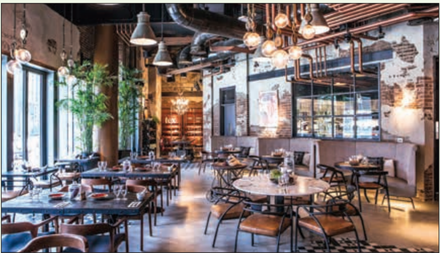
«كوكوا كيتشن» حيث تجهز جميع الأطعمة في هذا المطعم الفريد من نوعه من نبتة الكاكاو