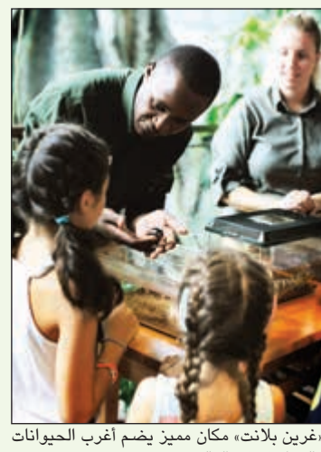
«غرين بلانت» مكان مميز يضم أغرب الحيوانات والزواحف في العالم

إذا اردت أن تخرج من الفندق وتوجه إلى التسوق والجلوس في الهواء الطلق في المقاهي والمطاعم الفاخرة، فما عليك إلا التوجه إلى «سيتي ووك»، ويعتبر مركزا تجاريا غير تقليدي حيث يعد أحد أحدث المشاريع التجارية في الهواء الطلق في إمارة دبي، ويقع على مساحة 13 ألف متر مربع، ويقدم للمتسوقين تجربة تسوق رائعة ومشوقة في أجواء