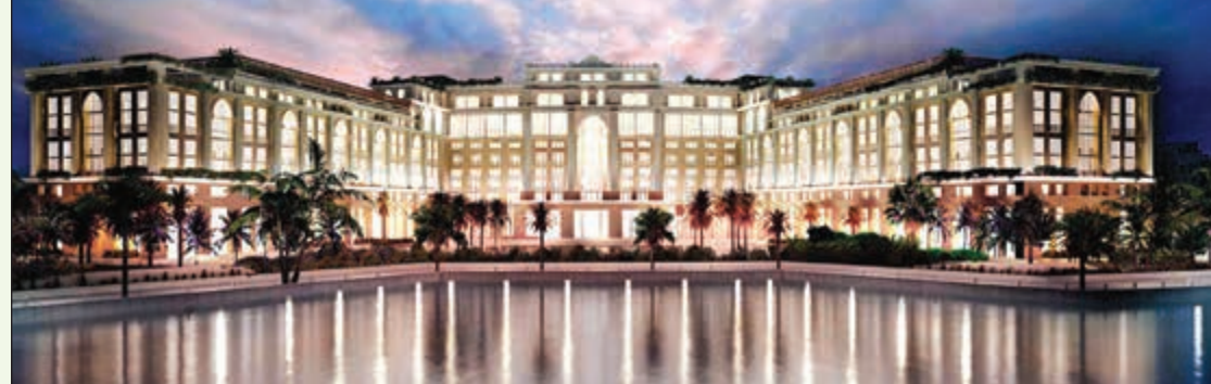
فندق بلازو فيرستاشي أحد أحدث الفنادق الفاخرة في دبي

متعة، ويحتوي سيتي ووك على عدد من المطاعم والمقاهي الراقية التي تقدم مختلف المأكولات العالمية، إضافة إلى العديد من المحلات التجارية لمحبي الموضة والمراكات العالمية. إن أجمل مكان يمكن زيارته في هذه المنطقة هو «كوكوا كيتشن» حيث تتميز الأطعمة في هذا المطعم الفريد من نوعه من نبتة الكاكاو، ويمكن للزائر أن يتناول مجموعة واسعة من الأطعمة في قائمة الطعام التي تحتوي على هذه النبتة كذلك هناك المشروبات الرائعة ذات النكهة الكاكاو المميزة. وعلى مقربة من هذه المطاعم تقع «غرين بلانت»، وهو مكان مميز يقع ضمن مبنى من 4 طوابق ويضم أغرب الحيوانات والزواحف في العالم، حيث يمكن العيش تجربة فريدة وكنك داخل الإذغال في قلب دبي.