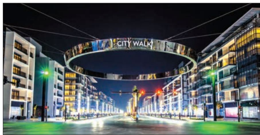
«سيتي ووك» دبي أحد أبرز التجمعات التجارية الفخمة الجديدة وسط المدينة

6 بالنسبة للرياضيين وعشاق المغامرة، فمدينة