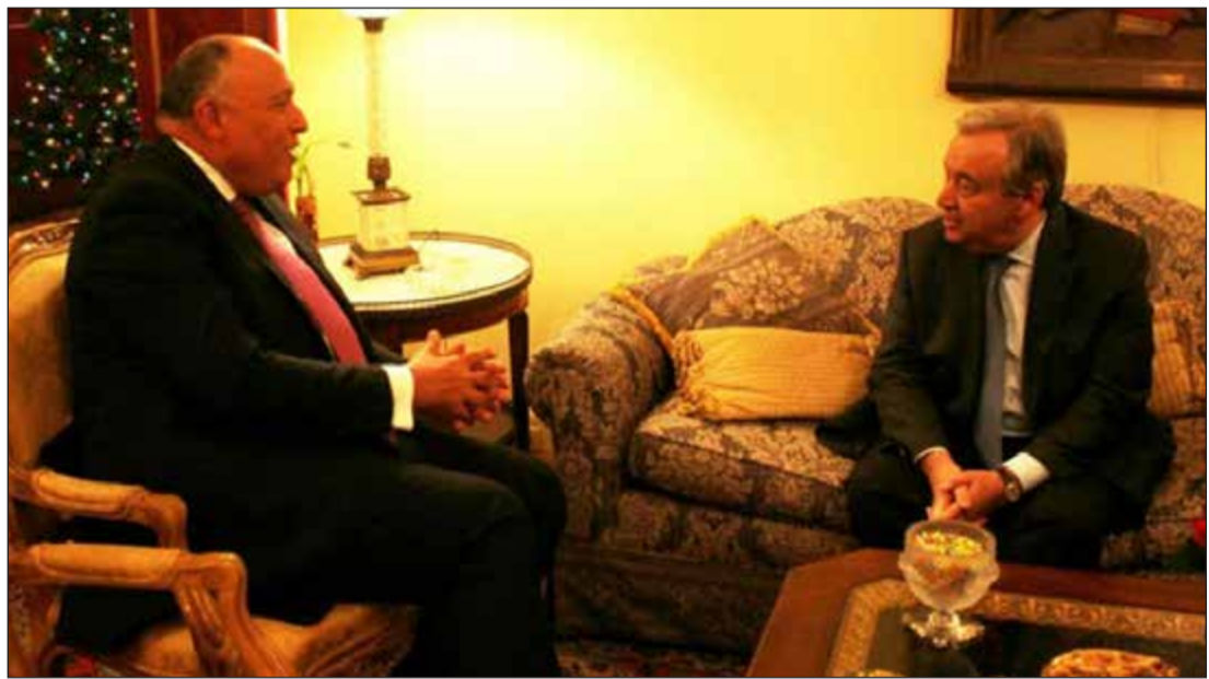
الوزير سامح شكري خلال مباحثاته مع أمين عام الأمم المتحدة الجديد أنطونيو جوتيريس

المضطرب الذي نعيشه ولاسيما في منطقة الشرق الأوسط وما تشهده من أزمات متلاحقة. ومن جانبه، أعرب جوتيريس عن خالص امتنانه لدعم مصر لترشحه لمنصب سكرتير عام الأمم المتحدة، مبديا تقديره لدور القاهرة الرائد كركيزة للاستقرار في المنطقة والعالم وما تبذله من جهود دؤوبة خلال عضويتها الحالية بمجلس الأمن لهيئة مناخ أفضل لاستعادة السلم والأمن في الشرق الأوسط وأفريقيا. وأكد حرصه على تعزيز التواصل والتنسيق والعمل مع مصر عن قرب خلال الفترة المقبلة من أجل تعزيز دور المنظمة الدولية لاسيما في ظل مواقف مصر الثابتة والمستقلة إزاء مختلف القضايا الإقليمية والدولية، فضلا عما تتمتع به من تقدير كبير لدى الأعضاء الواسعة من العضوية العامة للأمم المتحدة وحرصها على تفعيل