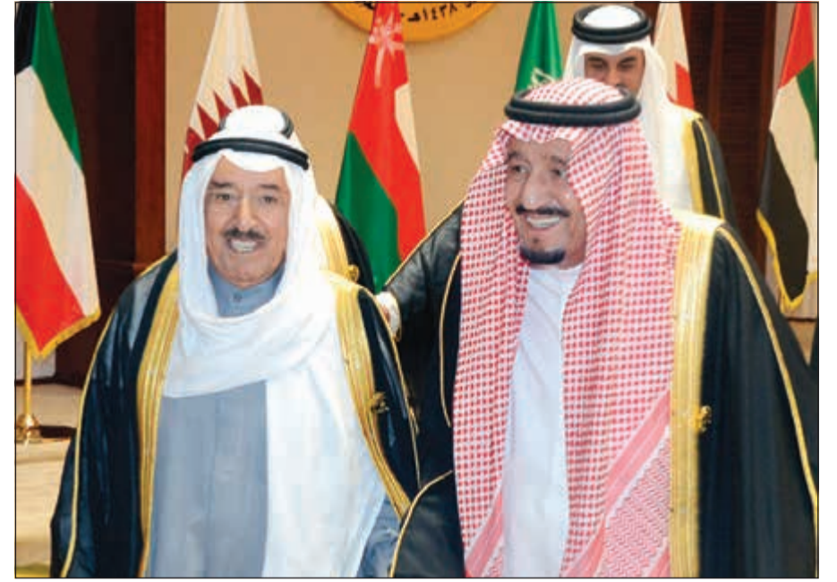
صاحب السمو الأمير الشيخ صباح الأحمد وخدام الحرمين الشريفين الملك سلمان بن عبدالعزيز

صاحب السمو عبر عن اعتزازه برؤية خادم الحرمين لمسيرة المجلس وما تم التوصل إليه في إطارها من إنشاء هيئة الشؤون الاقتصادية والتنمية لتجسيد تلك الرؤية