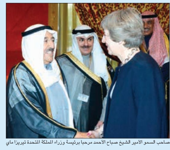
صاحب السمو الأمير الشيخ صباح الأحمد مرحباً برئيسة وزراء المملكة المتحدة تيريزا ماي

صباح الأحمد مساء أمس رئيسة وزراء المملكة المتحدة تيريزا ماي، وذلك في مقر إقامة سموه بالعاصمة المنامة. هذا، وتم خلال اللقاء بحث العلاقات التاريخية المميزة بين الكويت والمملكة المتحدة الصديقة في جميع المجالات استقبل صاحب السمو الأمير الشيخ صباح الأحمد مساء أمس رئيسة وزراء المملكة المتحدة تيريزا ماي، وذلك في مقر إقامة سموه بالعاصمة المنامة. هذا، وتم خلال اللقاء بحث العلاقات التاريخية المميزة بين الكويت والمملكة المتحدة الصديقة في جميع المجالات