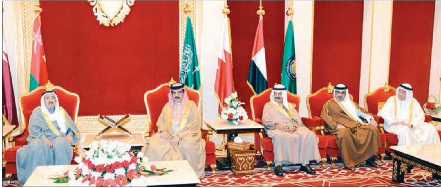
صاحب السمو الأمير الشيخ صباح الأحمد وملك حمد بن عيسى ورئيس وزراء البحرين صاحب السمو الملكي الأمير خليفة بن سلمان وولي عهد البحرين صاحب السمو الملكي الأمير سلمان بن حمد آل خليفة