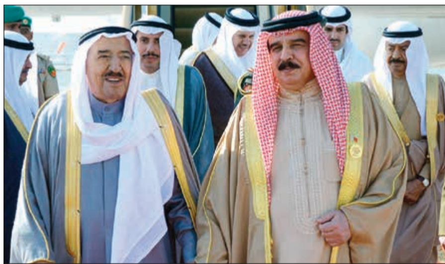
الملك حمد بن عيسى في استقبال صاحب السمو الأمير الشيخ صباح الأحمد لدى وصوله

انخفاض أسعار النفط يتطلب البحث عن مجالات للتعاون تحقق المصالح العليا لدولنا وتسهم في تمكيننا من تحقيق التنمية المستدامة المنشودة لأوطاننا