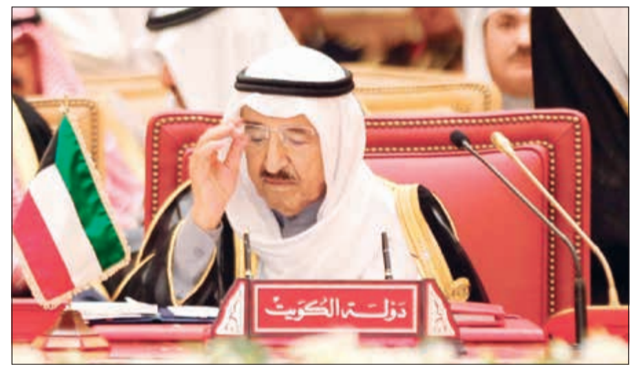
صاحب السمو الأمير الشيخ صباح الأحمد مترشداً وفد الكويت في افتتاح قمة التعاون

القمة تأتي في ظل متغيرات دولية متسارعة وأوضاع صعبة تتطلب تشاوراً مستمراً وتنسيقاً مشتركاً لدراسة أبعادها وتحسين دولنا من تبعاتها انخفاض أسعار النفط يتطلب البحث عن مجالات للتعاون تحقق المصالح العليا لدولنا وتسهم في تمكيننا من تحقيق التنمية المستدامة المنشودة لأوطاننا نواصل دعمنا لجهود المبعوث الأممي لليمن ونجدد إدانتنا الشديدة لاستهداف جماعة الحوثي وعلي صالح لمكة المكرمة