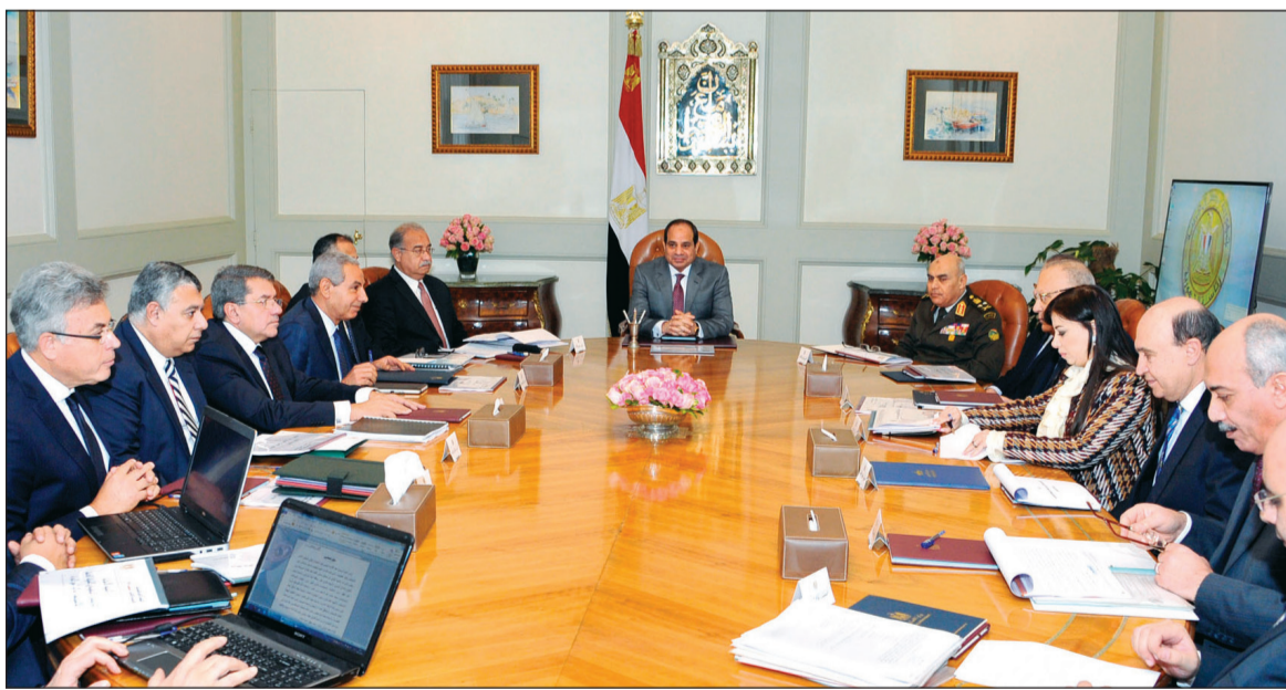
الرئيس عبدالفتاح السيسي يترأس الاجتماع الثنائي للمجلس الأعلى للاستثمار بحضور كامل أعضائه