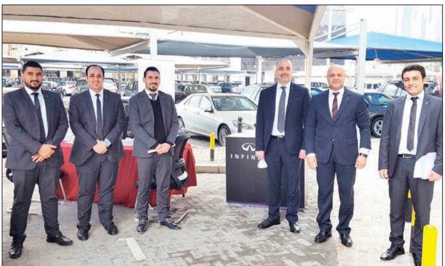
فريق عمل إنفينيتي البابطين

والجانبية المهمة، كما تجمع طرازاتها كافة بين الأناقة المتألفة والرفاهية الأسرة والقوة في الأداء والإنسيابية في الحركة، بالإضافة إلى أسلوب «إنفينيتي» في الاعتماد على أحدث التقنيات في العالم، ما يجعلها الأكثر تطورا بين السيارات الذكية ذات التكنولوجيا الفائقة.