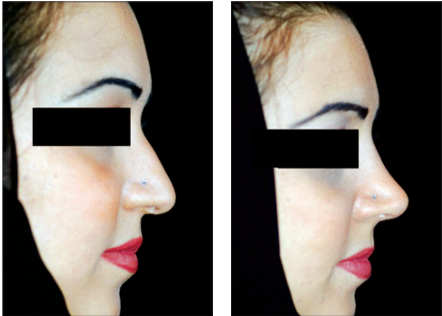
تنحيف الأنف عن طريق إبر تؤخذ في المكان الذي يتميز بسماكة الجلد