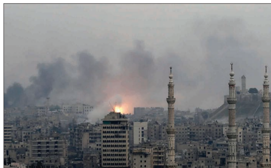
التيران تتصاعد بعد غارة لطائرات النظام على أحياء حلب الشرقية أمس

يرفض الخروج سيعتبر اراھبياً. في غضون ذلك، أعلنت وزارة الدفاع الروسية نشر فوج كامل يتألف من عدة بطاريات من منظومات أس 300 للدفاع الجوي في ميناء طرطوس. وقالت الوزارة: إنه تم تشييد مدينة عسكرية كاملة في طرطوس كما تم تشييد البنية التحتية الضرورية لنشر هذه المنظومات. بماوارة ذلك أعلنت وزارة الدفاع الروسية أمس تحطم مقاتلة لها من طراز «سو 33» بعد فشل هبوطها على حاملة الطائرات «كوزنيتسوف» قبالة السواحل السورية، لتصبح ثاني طائرة روسية تحطم بنفس الطريقة خلال نحو 3 أسابيع.