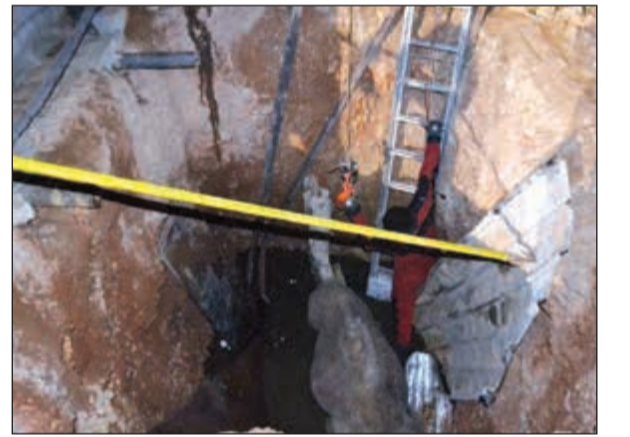
الجمل في الحفرة

الرياض - العربية: نت: أنقذ الدفاع المدني في الرياض جملًا سقط في خزان أرضي بحى السلي. وغرد الحساب الرسمي للدفاع المدني: «مدني لرياض ينقذ جملًا بعد سقوطه في خزان أرضي بحى السلي». وقامت فرق الإنقاذ عقب تلقيها البلاغ بالتوجه إلى الموقع، واستخرجت الجمل عبر إحدى الآليات، وجرى سحبه إلى خارج الخزان.