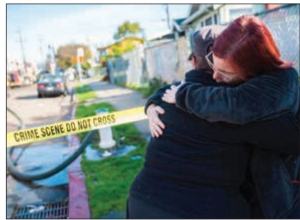
حزن على أحد الضحايا

بعد أن أخبرها بأنهما سيتوجهان إلى حفل موسيقي في أوكلاند. وقال للصحيفة «أريد العثور عليه فقط». وبعض المفقودين من الجانب، ما يجعل من الصعب التعرف على الضحايا الذين يعتقد أنهم في العشرينيات والثلاثينيات من العمر. وأكدت رئيسة فرقة الإطفاء ريد أنه «لم يكن هناك مدخل أو مخرج حقيقي». وأضاف أن المستودع كان مليئاً بالمفروشات والأعمال الفنية المعروضة، وما زال من الصعب الدخول إلى المبنى. واستخدمت الشرطة طائرات بلا طيار مزودة بأجهزة استشعار حرارية لتحديد الأماكن الخطيرة والتي لا تزال الحرارة فيها مرتفعة. ونقلت صحيفة «سان جوزيه ميركوري نيوز» عن فرق الإطفاء قولها أن نحو 70 شخصاً كانوا يشاركون في هذه الحفلة التي كانت فرقة غولدن دونا للموسيقى الإلكترونية تحييها في أوكلاند قرب سان فرانسيسكو في كاليفورنيا. وينبغي أن يحدد التحقيق ما إذا كان أصحاب المستودع القديم والمقيمون فيه يملكون كل التصاريح اللازمة.