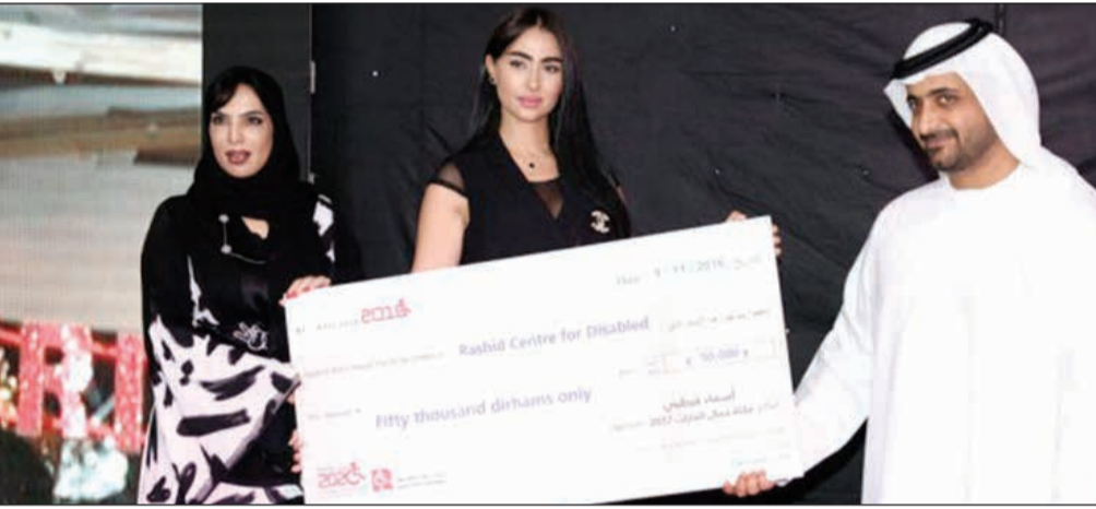
المبلغ الذي تبرعت به ملكة جمال القارات

قرطبي إعجابها الشديد بإداء الممثل السوري عابد فهد، مشيرة إلى أنه يعتبر «القدوة» في مجال التمثيل، وضربت المثل عالمياً بالنجمة أنجيلينا جولي، فيما يخص الأداء التمثيلي والإنسانية التي يتوجب على كل المشاهير التمتع بها. وعن قوتها بين الفنانين العرب، أضافت: «أقتدي دائماً بالفنانة ميساء مغربي، وأتمنى أن أصل إلى مستواها، وأطمح دائماً إلى السير على خطاها».