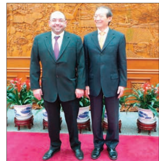
نائب وزير الخارجية الصيني تشانغ مينغ مع الزميل يوسف خالد المرزوق