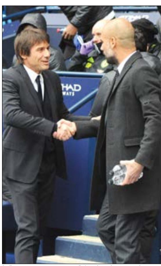
كونتي تشلسي تفوق على غوارديولا سيتي

سمير بوسعد قال مدرب تشلسي الإيطالي انطونيو كونتي كلمته وترجع على عرش الترتيب في الدوري الإنجليزي (34) نقطة، بعد أن حسم المواجهة النارية أمس، بأحداثها وإيقاعها الهجومي قبل انطلاق كلاسيكو الأرض بساعة واحدة فقط، ضمن منافسات افتتاح المرحلة الثالثة عشرة. وطرح كونتي خصمه الإسباني غوارديولا الفيلسوف مدرب مانشستر سيتي وصانع إنجازات برشلونة التاريخية بالفوز عليه 1-3، مع الرفافة وفي عقر داره ملعب «الاتحاد» الكبير، وهنا، استحققت عبارة «متصدرا لا تكلمني»، التي درج الكثيرون على نطقها في «السوشيال ميديا»، وانتشرت في الوسط الرياضي العربي والخليجي وفي الكويت تحديدا، معبرة عن لسان حال مشجعي تشلسي اللندني بعد الفوز المدروس بتكتيك إيطالي بحت، رغم النهاية التي شهدت «هوشة» بين اللاعبين، ورفع تشلسي، بطل 2010 و2015، رصيده إلى 34 نقطة من 14 مباراة محققا فوزه الثامن على التوالي في إنجاز لم يحققه منذ 2010، مقابل 30 لكل من ليفربول ومانشستر سيتي بطل 2012 و2014، وهذه أول مرة منذ إبريل 2009 يخسر مانشستر سيتي على أرضه في الدوري بعدما كان متقدما بالنتيجة.