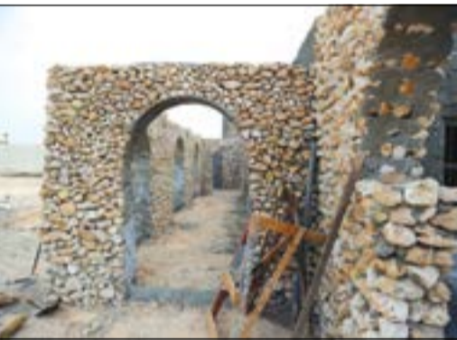
جانب من الكويت القديمة في قرية «صباح الأحمد» التراثية