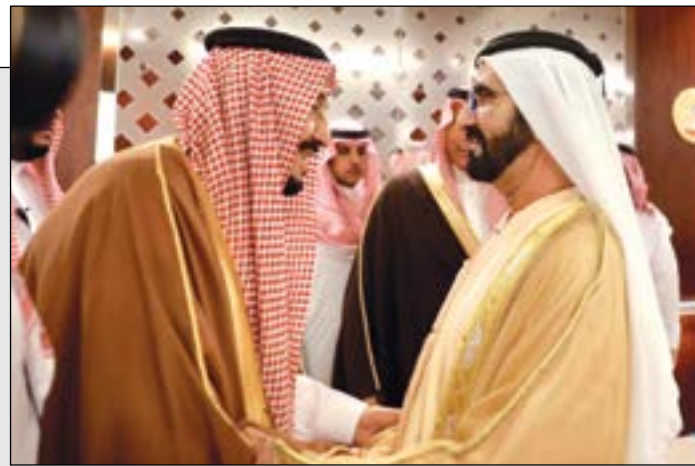
خادم الحرمين الشريفين الملك سلمان بن عبدالعزيز مصافحا صاحب السمو الشيخ محمد بن راشد آل مكتوم نائب رئيس دولة الإمارات رئيس مجلس الوزراء حاكم دبي عقب وصوله أبوظبي أمس

خادم الحرمين الشريفين في جولة خليجية يستهلها بالإمارات 36