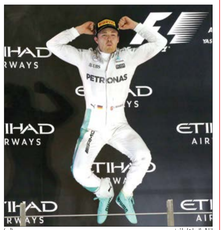
انا البطل يا هاميلتون

واستخدم هاميلتون استراتيجية «الملجا الاخير» عندما خفف سرعته بهدف السماح للسائقين الاخرين بتضييق الخناق على روزبرغ وتجاوزه، خصوصا في