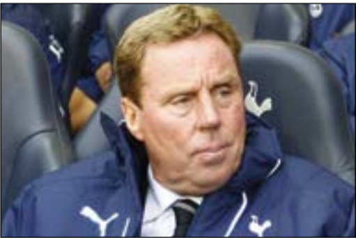
مدرب توتنهام السابق هاري ريدناب

شكك مدرب توتنهام السابق هاري ريدناب في قدرة تشلسي على نيل لقب الدوري الإنجليزي الممتاز هذا الموسم، على الرغم من العروض المبهمة التي يقدمها النادي اللندني، والتي تمثلت في فوزه في 7 مباريات متتالية وأخيرا الفوز على توتنهام 2-1. ريدناب اعتبر أن فريقه السابق كان أفضل من تشلسي في المباراة أول من أمس وأقوى منه بتشكيلته الكاملة من دون إصابات، كما رشحه للمنافسة على اللقب. ويشعر ريدناب بأن النتيجة كانت ستكون مختلفة لو كان توتنهام يلعب بتشكيلته الكاملة، حيث افتقد الفريق اللندني إلى خدمات عدد من عناصره إما بسبب الإيقاف أو الإصابة، ودخل بدكة بدلاء جملها أسماء شابة وصغيرة. وقال المدرب الإنجليزي المخضرم الذي يعمل كحطل في شبكة «بي.تي» الإنجليزية «أعتقد بوجود فريق توتنهام لائقا ومن دون أي غيابات، فانا لست بحاجة حتى إلى الاستعانة بأي لاعب من تشلسي في فريق توتنهام». وأضاف: «صحيح تشلسي يحتل الصدارة، لكن الدوري لا ينتهي اليوم، توتنهام افتقد لخدمات دريفيلد وداني روث، وبالتشكيلة الكاملة له فهو فريق ممتاز».