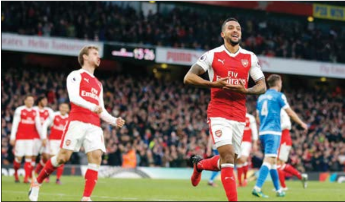
ملك يا تشيلي أفرحت عشاق أرسنال