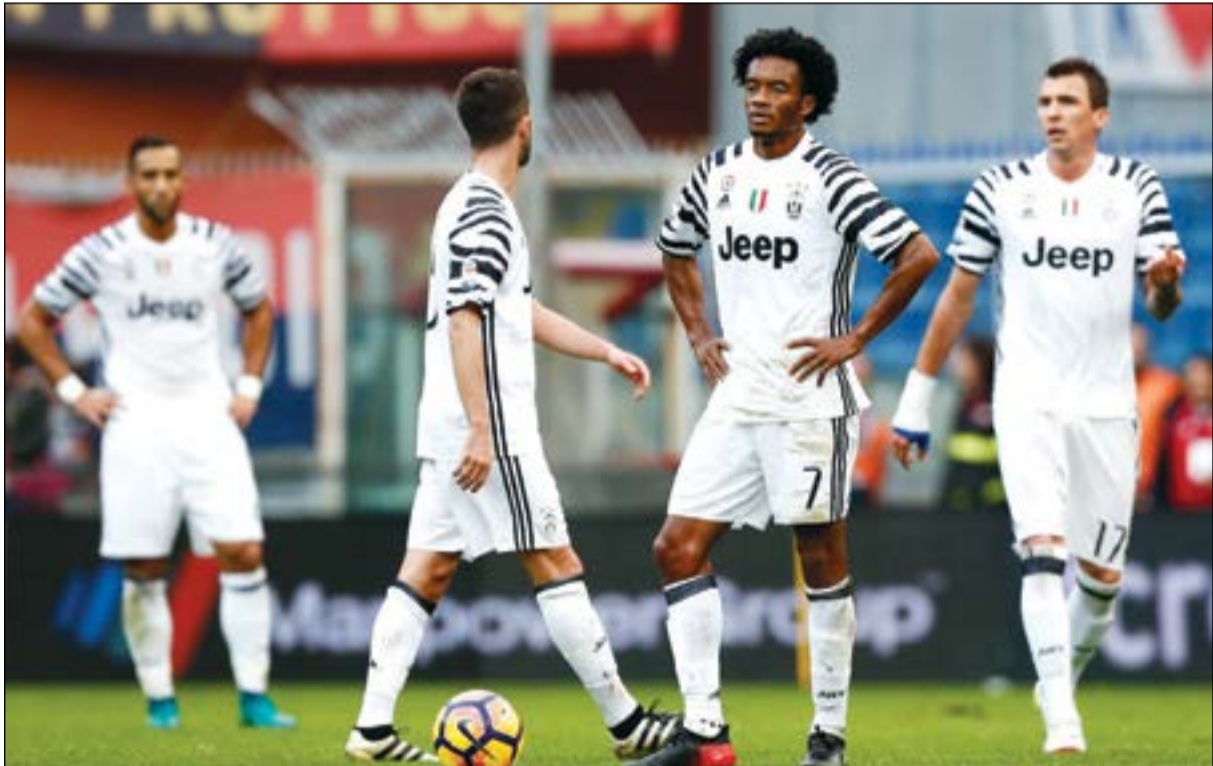
سقط البيرفي بقوة