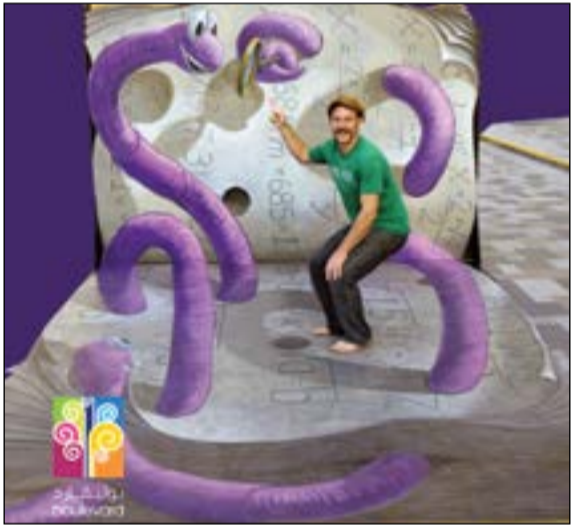
رسم ثلاثي الأبعاد لأول مرة في الكويت