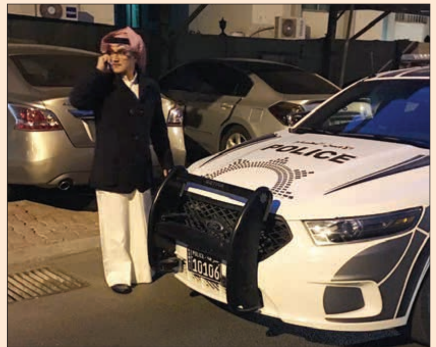
اللواء إبراهيم الطراح اثناء تواجده بموقع الجريمة منذ الصباح الباكر