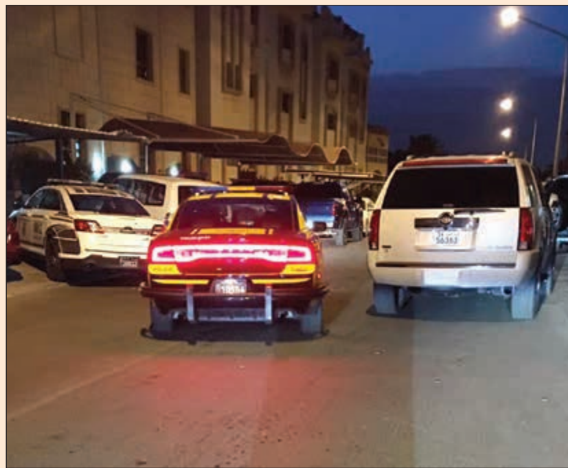
انتشار دوريات التجدة والأمن العام

لا يزال هذا الطريق يمثل صداعا للمواطنين والمقيمين الذين يرتادونه من السالمية الى مجمع الأقدوز.