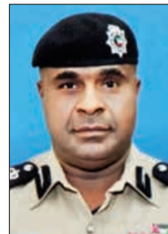
العميد عبدالله سفاح

ورئيس قسم الدوريات بالإنابة النقيب سعد سالم العصفور، استطاعت ضبط مواطن مطلق على ذمة 5 قضايا مدني بمبالغ متنوعة. وكانت إحدى دوريات امن الاحمدي وخلال تجولها على طريق الفحيحيل السريع قد شاهدهت مركبة تسير بسرعة كبيرة فاشتبهت في قائدها وتم إيقافه وذلك للتأكد من أسباب السرعة، وعند الاستعلام عنه تبين لاحقاً انه مواطن فتم توقيفه وتبين أنه مطلوب لإدارة التنفيذ المدني على ذمة 5 قضايا، يبلغ مجموع المبالغ المدين بها 41 ألف دينار، وقد أحيل إلى جهات الاختصاص لتنفيذ أمر ضبطه وإحضاره.