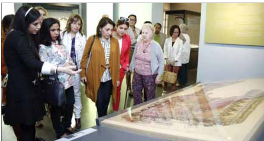
جانبا من الجولة في دار الآثار الإسلامية