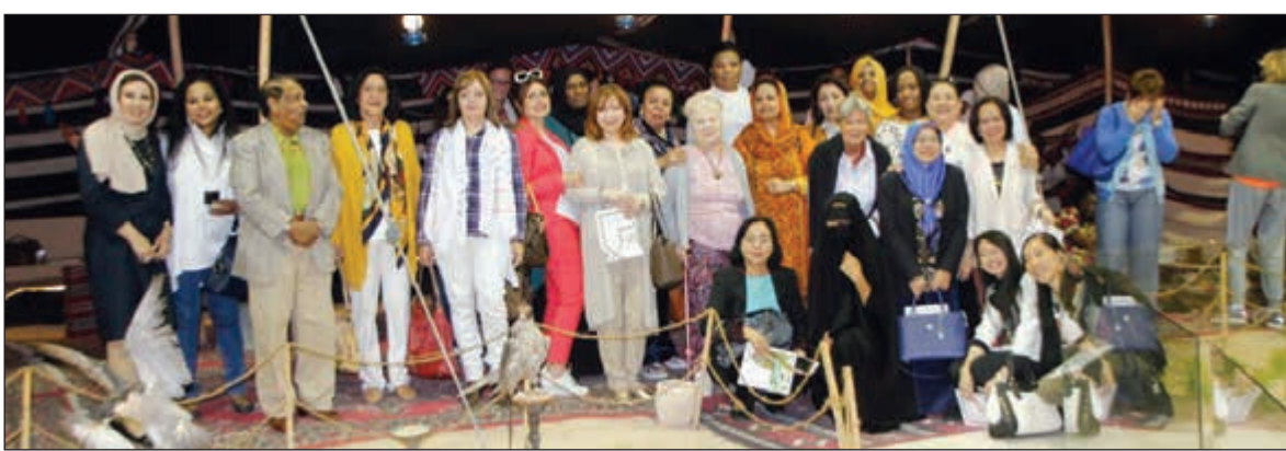
جناح البنية البرية في «بيت العثمان»

نظم قطاع السياحة بوزارة الإعلام رحلة سياحية ترويجية ثقافية لزوجات الدبلوماسيين والسفراء وخاصة الجدد منهن بالتنسيق مع لجنة المرأة الكويتية، وذلك للتعرف على المعالم السياحية والثقافية في الكويت، وتضمنت الرحلة زيارة الى دار جيهان في متحف «طارق رجب» للمخطوطات الإسلامية وزيارة الى متحف «بيت العثمان» والتعرف على تاريخ الكويت والانجازات التي صاحبته نهضة دولتنا الحبيبة.