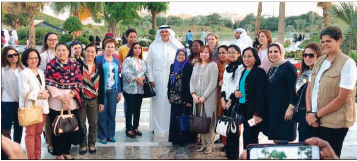
وزير الإعلام ووزير الدولة لشؤون الشباب الشيخ سلمان الحمد متوسلاً عضوات اللجنة الدولية في حديقة الشهيد