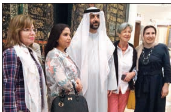
لقطة في دار جيهان