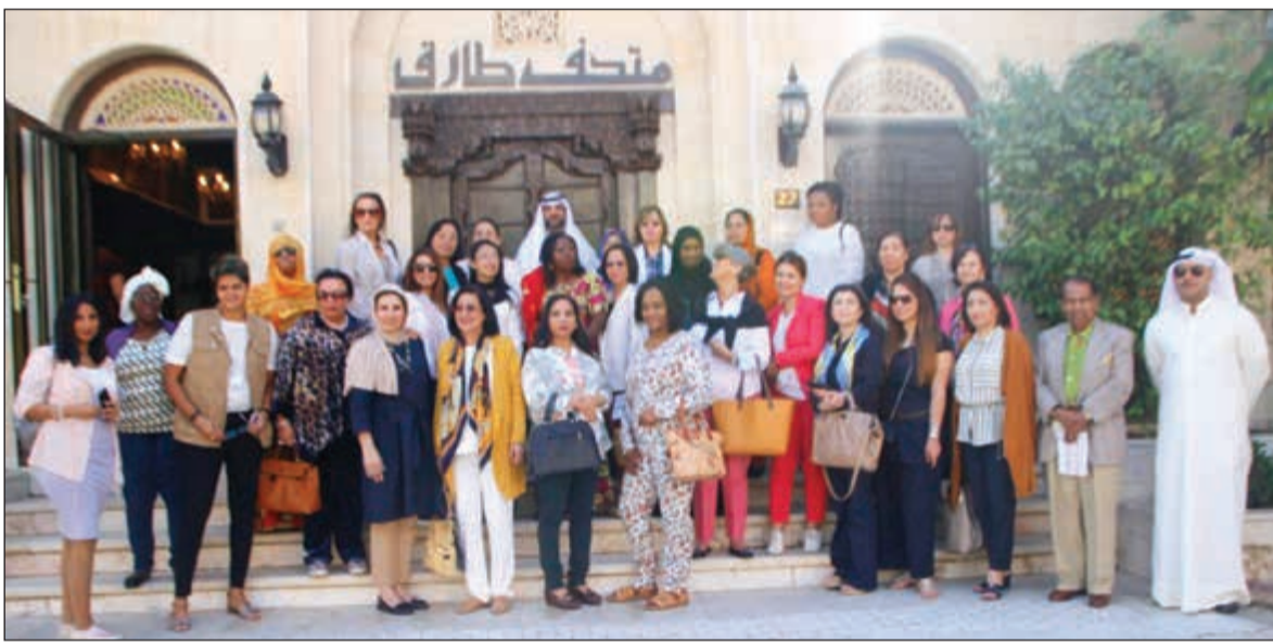
المشاركات أمام متحف طارق