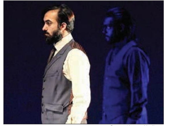
بدر الحلاق في المسرحية