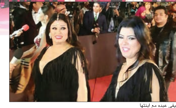
فيفي عبده مع ابنتها