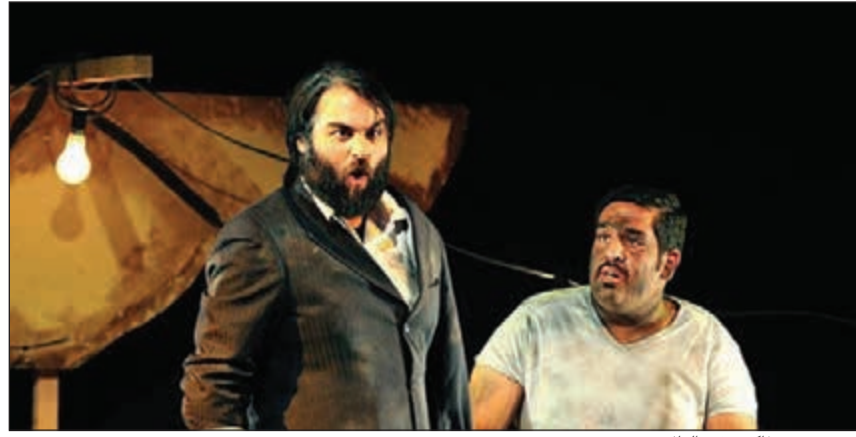
مشهد من «ذاكرة في الظل»