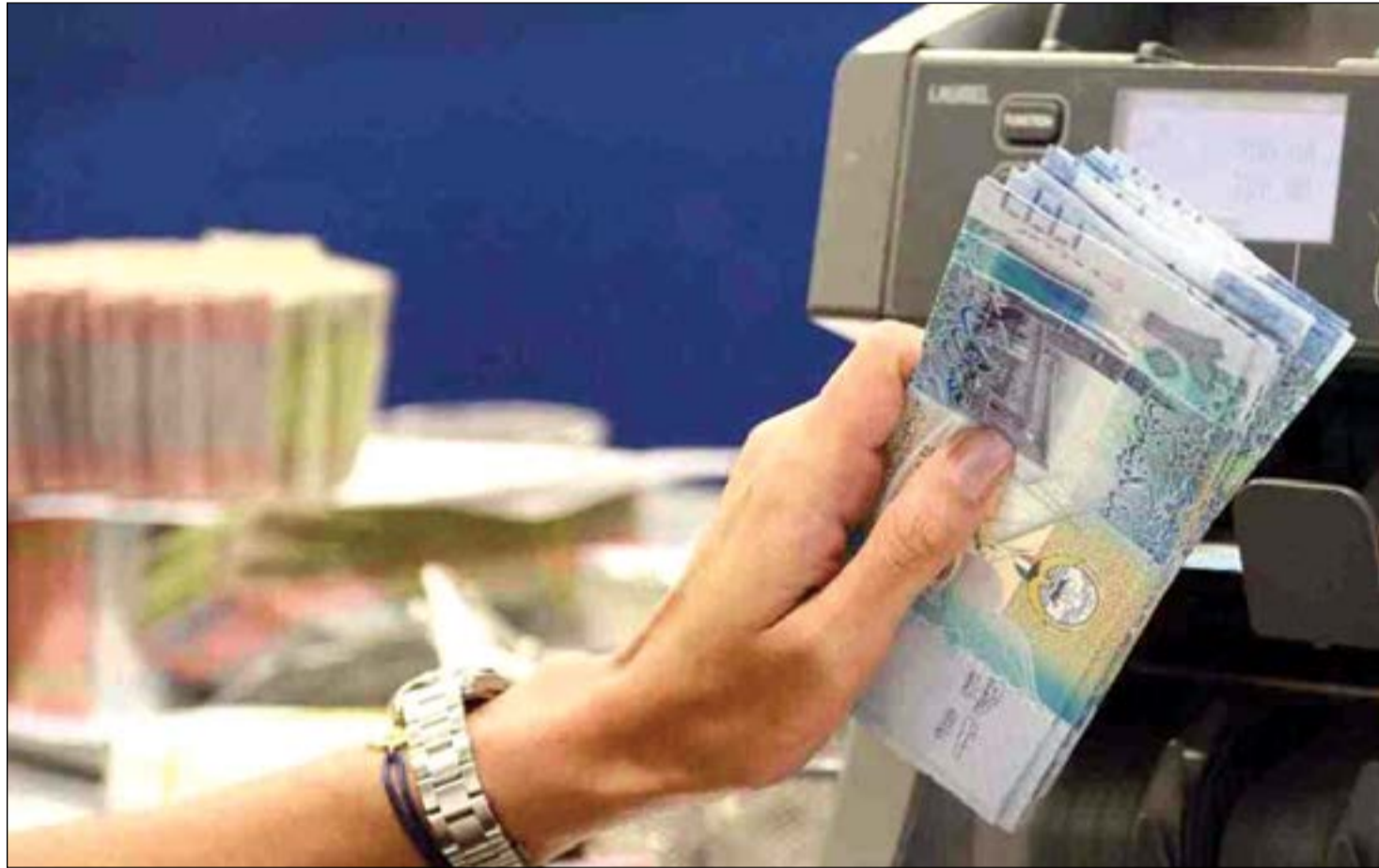
الدولار الأميركي يبلغ أعلى مستوى منذ ثماني سنوات أمام الدينار خلال تعاملات الأسبوع الماضي

وأشار المحللون إلى أن احتماليات رفع أسعار