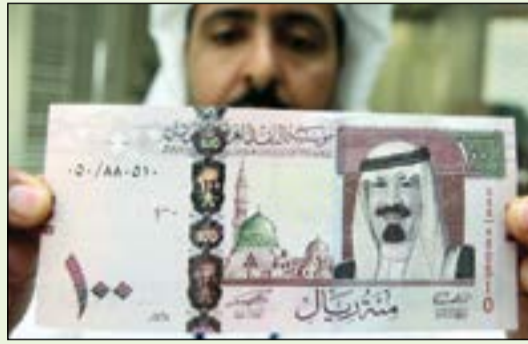
الريال السعودي يقفز لأعلى مستوى أمام اليورو تاريخياً

تراجع اليورو أمام الريال السعودي بنسبة 2٪ ليبلغ سعر صرف الريال أمام اليورو نحو 0,251 يورو مقارنة بـ 0,246 يورو بنهاية تداولات العام الماضي ليبلغ بذلك الريال أعلى مستوى أمام اليورو في تاريخه.