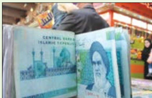
تراجع كبير للريال الإيراني أمام الدولار في مستويات قياسية لم تشهدها المصارف منذ الاتفاق النووي

شهدت أسعار صرف الدولار أمام الريال الإيراني امس ارتفاعاً كبيراً، حيث سجل الدولار مستويات قياسية لم تشهدها المصارف الإيرانية منذ الاتفاق النووي بين طهران والدول الست الكبرى.