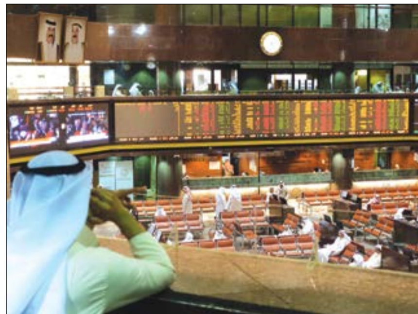
عمليات بيع على الاسهم القيادية لجني الارباح