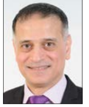
إعداد: د. طارق البكري