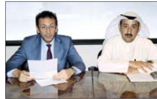
السفير جوسيب سكونيا ميليو ومحمد العسوسى خلال المؤتمر الصحافي

للبحث والتطوير وأكثر من 20 جامعة إيطالية مصنفة بين أفضل 500 جامعة في العالم. إن نوعية الحياة التي يمكن أن تقدمها إيطاليا، بمناظرها الطبيعية الخلابة وفننها وتاريخها العريق وثقافتها ومطبخها، تعد فريدة من نوعها ولا تضاهي، مرمبا عن امهه في أن نتج هذه المبادرة في استقبال المشاركة الحماسية من قبل أصدقائنا الكويتيين ولا سيما الشباب. وتوجهه سكونيا ميليو بالشكر والتقدير إلى المجلس الوطني للثقافة والفنون والآداب، للدعم القيم الذي قدمه لتنظيم الحفلات الموسيقية الثلاثة والتي ستقام ضمن فعاليات الأسبوع، مثمنا دور جميع رعاة الأسبوع الإيطالي لمساهمتهم الكريمة من أجل تحقيق «الأسبوع الإيطالي» - ومن جهته، أكد الأمين العام المساعد لقطاع الثقافة والفنون الوطني محمد العسوسى على عمق العلاقات الكويتية - الإيطالية، لافتا إلى أن إيطاليا دولة حاضنة للثقافة بتاريخها العريق، لافتا إلى أن مشاركة المجلس الوطني للثقافة والفنون والآداب تنبثق من واقع الاتفاقيات الثنائية لدعم التبادل الثقافي الموقعة بين البلدين الصديقين. وأشار العسوسى بعدد من الفعاليات الثقافية والفنية المميزة التي ستقام في إطار