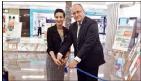
السفير البولندي لدى الكويت جشيجوش أولشاك يفتتح المعرض

حديثة فائقة الجمال والروعة، موضعا ان المباني الحديثة في بلاده صمما معماريون بولنديون اصحاب شهرة عريقة وحاصلون على جوائز في مسابقات عالمية، مرمبا عن سعادتة لعرض هذه الروائع المعمارية في مجمع الحرما الحديثة الذي يعطي لهذا المعرض زخما كبيرا. وأشار الى ان الكويتيين اكتشفوا مؤخرا بولندا كوجهة سياحية مميزة فزاد إقبالهم على زيارتها بشكل ملحوظ، موضحا انه عندما بدأ مهام عمله في الكويت قبل 3 سنوات كان القسم القنصلي في السفارة يصدر حوالي 300 تأشيرة سنويا، بينما يصدر حاليا ما يقارب الـ 2000 تأشيرة سنويا. وكشف عن ان بلاده بدأت باستقبال المرضى الكويتيين منذ مطلع العام الحالي، لافتا الى انه لمس الرضا من المرضى الكويتيين العائدين من العلاج