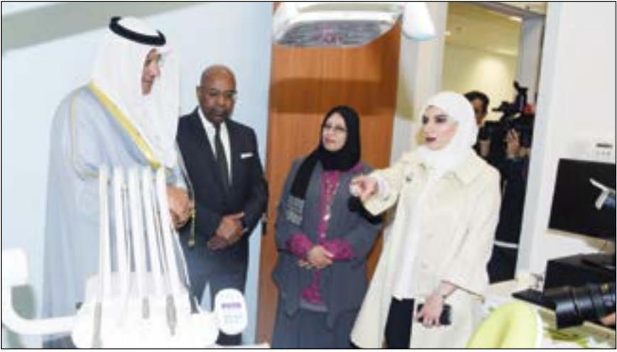
الوزير العبيدي يتفقد أحدث الأجهزة والمعدات في مركز جابر لطب الأسنان