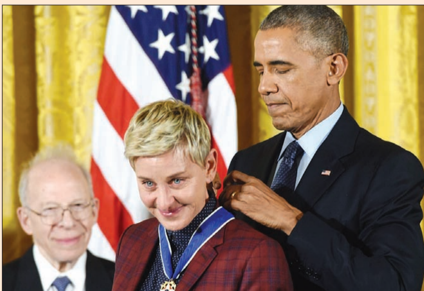
وسام الحرية لإيلين دجينيريس (أب)

نيويورك - وكالات: قام الرئيس الأمريكي باراك أوباما يوم أمس بمنح وسام الحرية الرئاسي لعام 2016 لـ 21 شخصية في البيت الأبيض. ومن بين المكرمين الممثلين توم هانكس وروبرت دي نيرو وروبرت ريدفورد والمغني بيروس سيرينغستين والمغنية ديانا روس ومقدمة البرامج الحوارية إيلين دجينيريس التي بكت في الحدث وواساها روبرت دي نيرو.