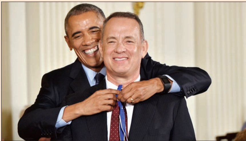
أوباما مقلدا توم هانكس الوسام

نيويورك - وكالات: قام الرئيس الأمريكي باراك أوباما يوم أمس بمنح وسام الحرية الرئاسي لعام 2016 لـ 21 شخصية في البيت الأبيض. ومن بين المكرمين الممثلين توم هانكس وروبرت دي نيرو وروبرت ريدفورد والمغني بيروس سيرينغستين والمغنية ديانا روس ومقدمة البرامج الحوارية إيلين دجينيريس التي بكت في الحدث وواساها روبرت دي نيرو.