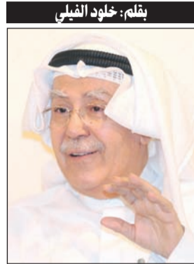
بقلم: خلود الفيلى

خصوصا أنه يتحدث عن وطنه الحبيب في مرحلة قديمة (أيام السور)، والكل يعرف أن مثل هذه البرامج التوثيقية كانت شغله الشاغل، وحتى عندما كان يظهر في زمن التطور الإعلامي عبر التل وت وسائل التواصل كان يستغلها في البحث والتعقيب عن شخصيات كانت علامات فارقة في تاريخ الكويت، ليعيد إحيائها منكرًا بإنجازاتها ومآثرها، فقد كان يخشى أن ينسى هذا الجيل تعب أجدادهم في زحمة الحياة ومتاعبها ومحناتها، وما من شخصية لعبت دورا في إثراء مرحلتها وفي تأسيسها لما بعدها إلا وكانت ضيفة في برامجه التي نتذكرنا بأصالتها ويتعب أهلنا الذي نتلفظ ثماره الآن وستقطفه الأجيال المقبلة.