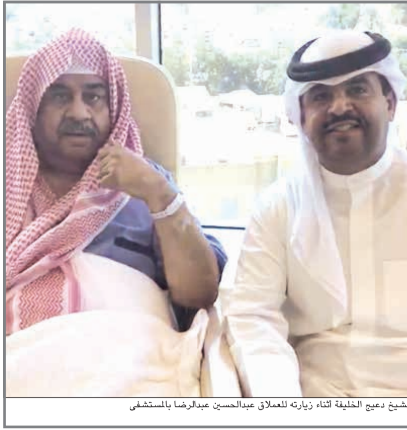
الشيخ دعيح الخليفة أثناء زيارته للعملاق عبدالحسين عبدالرضا بالمستشفى

يرقد الفنان القدير عبدالحسين عبدالرضا في مركز صباح الأحمد للقلب بمستشفى الأميري، وذلك بعد شعوره بحرارة في جسمه دعت أطباء المركز لإجراء فحوصات طبية شاملة للأطمئنان على صحة بوعدنان أكثر، وطلبوا منه المكوث في المستشفى عدة أيام للراحة. وطمان الشاعر الشيخ دعيح الخليفة جمهور ومحبي الفنان القدير، مؤكداً أنه بصحة جيدة، وقال الخليفة في تصريح لـ «الأنباء»: سيخرج بوعدنان بعد اطمئنان الأطباء تماماً على حالته الصحية وقد يغادر المستشفى بعد اسبوع تقريبا، مشيراً الى انه كان حريصا على ان يكون بجانبه ومتابعته حالته الصحية، مستطردا: عبدالحسين عبدالرضا هرم كبير ورائد من رواد الفن الكويتي، واتمنى له دوام الصحة والعافية. حالة الفنان القدير عبدالحسين عبدالرضا الصحية حاليا مستقرة والفحوصات كانت إيجابية. ما تشوف شر يا بوعدنان و سلامات يا عملاق الفن الخليجي.