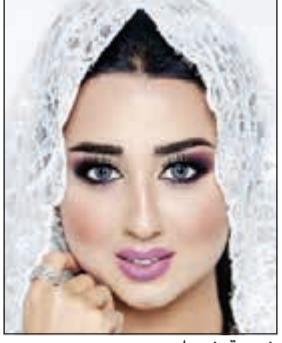
شبيهة شيماء سبت

عبرت النجمة البحرينية عن سعادتها باختيارها رئيسا لمجلس إدارة الجمعية الخيرية «متواجدون» التي أعلن عنها رسميا وقانونيا أكتوبر الماضي بموجب القرار رقم 87 لسنة 2016، وقالت شيماء: «اختياري لرئاسة مجلس إدارة الجمعية هو تكليف ومسؤولية كبيرة وسأبذل كل جهدي لأكون أهلا له»، وتوجهت بالشكر لكل من دعمها في هذا الأمر الخيري. وفي سياق آخر، عثرت شيماء على شبيهة لها، ونشرت مجموعة صور لها على حسابها الخاص على «انستغرام»، وعلقت: «الصورتين فوق اللي بالطرحة لبنت وايد وايد تشبهني.. بس الصورة اللي