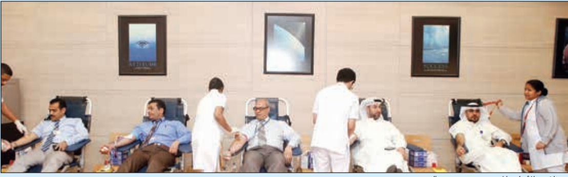
موظفو «الأهلي المتحد» يتبرعون بالدم

من يحتاج لنقل الدم، كما أشاد «الأهلي المتحد» بالإقبال الشديد الذي شهده من موظفيه على التبرع، والذي لولاه لما شهدت هذه الحملة النجاح الذي تحقق، مؤكدا على أهمية زيادة الوعي بمزايا التبرع بالدم لمواجهة الطلب المتزايد على الدم لمعالجة الإصابات ومرضى الجراحة. وأوضح البنك أنه يحرص دائما على القيام بدور فعال في المجتمع، وأن يكون موظفوه قدوة حسنة للعطاء للمجتمع.