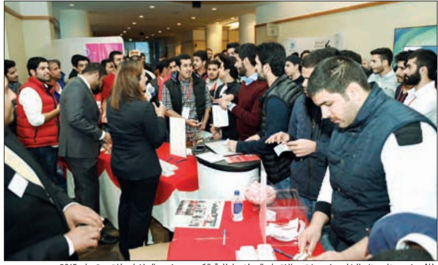
طلاب في جناح بنك الخليج في مؤتمر الاتحاد الوطني لطلبة الكويت - فرع الولايات المتحدة عام 2015

اعلن بنك الخليج عن رعايته الذهبية للمؤتمر الـ 33 للاتحاد الوطني لطلبة الكويت - فرع الولايات المتحدة الأميركية للعام الخامس على التوالي، والمزعم انعقاده خلال الفترة من 24 - 27 نوفمبر الجاري في سان فرانسيسكو، كاليفورنيا.