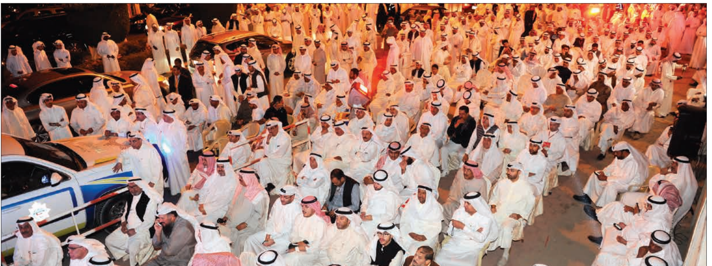
.. وحضور كبير في الخارج يتابعون الندوة بعد ان امتلا المقر عن آخره

وتابع بقوله: دول مجلس التعاون الخليجي هي العمق الاستراتيجي للكويت وعلاقتنا مع دول التعاون من أفضل ما يكون ويكفينا إشادة صاحب السمو.