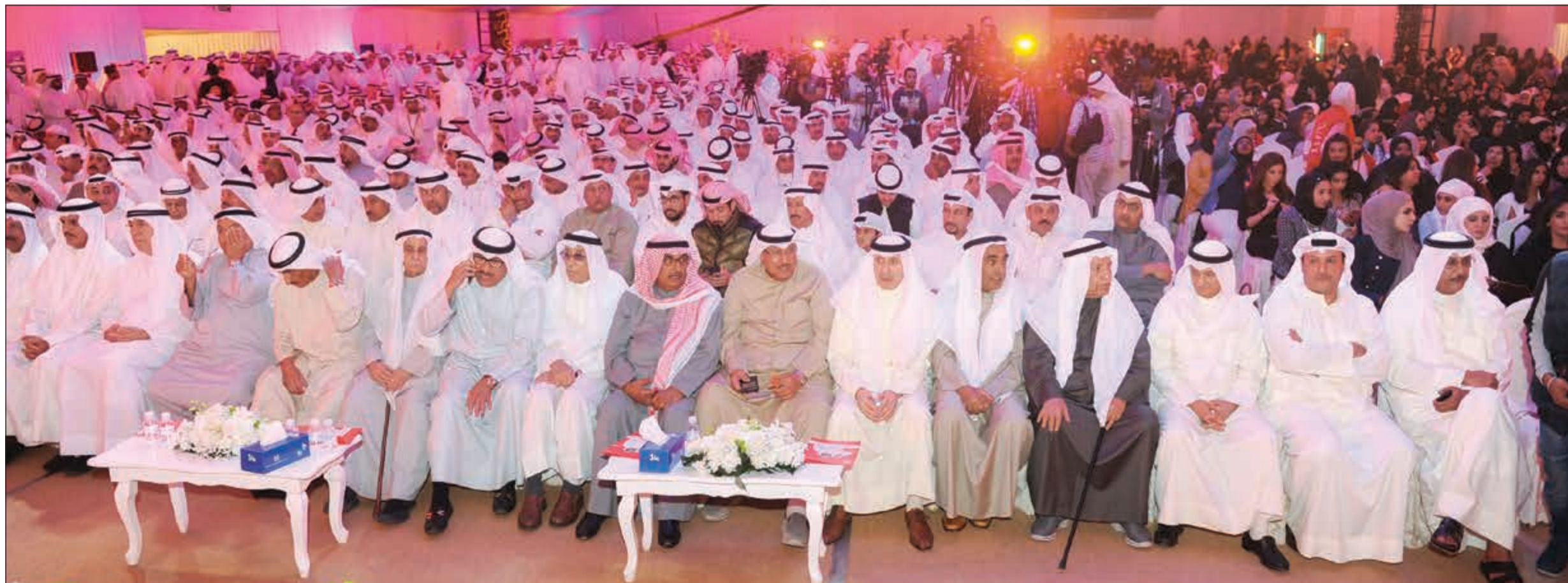
جانب من الحضور الحاشد داخل مقر الغانم

واضاف: احترمنا حكم «الدستورية» في ابطال المجلس الثاني، وشاركنا في الانتخابات، لكن بعض الأطراف كانت تمنى ان يتعطل مجلس 2013 ويقشل، وهي أمنية خاصة جاءت على حساب المصلحة العامة، مثنياً على من كان يعطي المشورة له طوال السنوات السابقة لتصويب الأخطاء.. «وهؤلاء تفكيرهم في مصلحة البلد ويهيمهم الكويت لذلك احببهم وأسجل احترامي لدورهم». ودعا الغانم كل من يجد في نفسه القدرة والرغبة في الترشح لرئاسة المجلس الى ان يتقدم، فهذا حقه، لكن اريد ان نوجهكم الى ما مررنا به