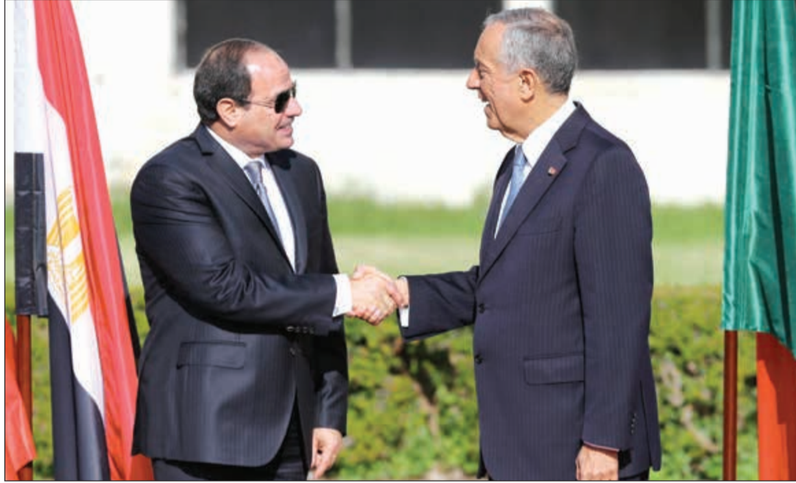
الرئيس البرتغالي مارسيلو ريبيلو دي سوزا مرحباً بالرئيس عبد الفتاح السيسي في القصر الجمهوري

لشبونة - وكالات: أكد الرئيس عبد الفتاح السيسي، أن القرب الجغرافي بين مصر والبرتغال، يفرض عليها التنسيق الوثيق، فيما يتعلق بمجابهة العديد من التحديات، التي تترى بها منطقتنا في المرحلة الحالية، وعلى رأسها انتشار الإرهاب والتطرف، ومحاولات تفكيك الدول والنيل من فكرة الدولة الوطنية وتقويض المؤسسات ومكافحة الهجرة غير الشرعية وتدفق اللاجئين، نتيجة استمرار الصراعات المسلحة والحروب التي يدفع ثمنها المدنيون. وقال السيسي خلال مؤتمر صحافي مع نظيره البرتغالي مارسيلو ريبيلو دي سوزا عقب مباحثاتهما الثنائية بالقصر الجمهوري في لشبونة أمس، إن المباحثات تناولت سبل التنسيق لحل عدد من الأزمات، التي باتت تسويتها ضرورة حتمية لأمن واستقرار البحر المتوسط سواء على المستوى الثنائي أو المحافل الدولية.