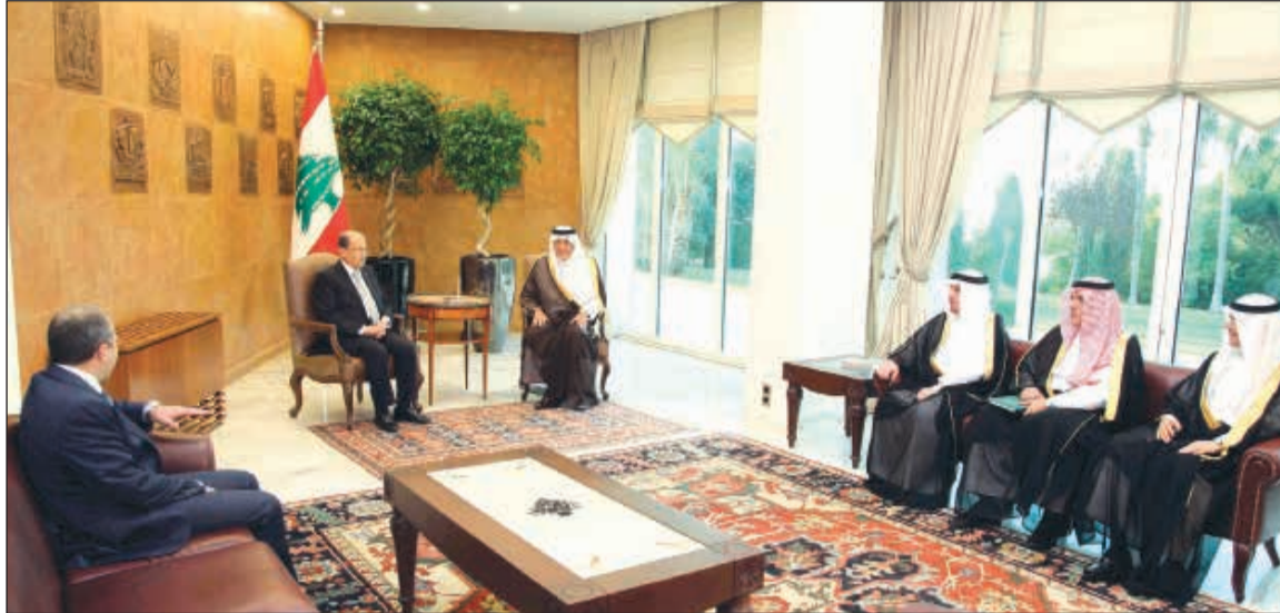
الرئيس العماد ميشال عون مستقبلاً صاحب السمو الملكي الأمير خالد الفيصل أمير مكة المكرمة والوفد المرافق في بعيدا (محمود الطويل)