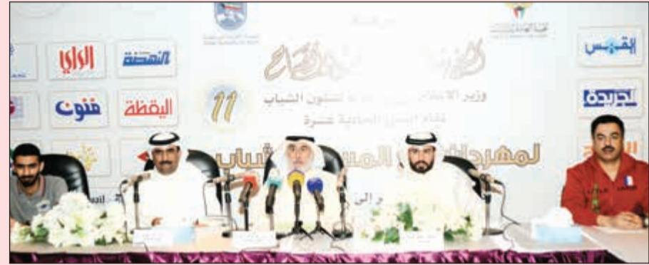
جانب من مؤتمر اللجنة العليا للمهرجان